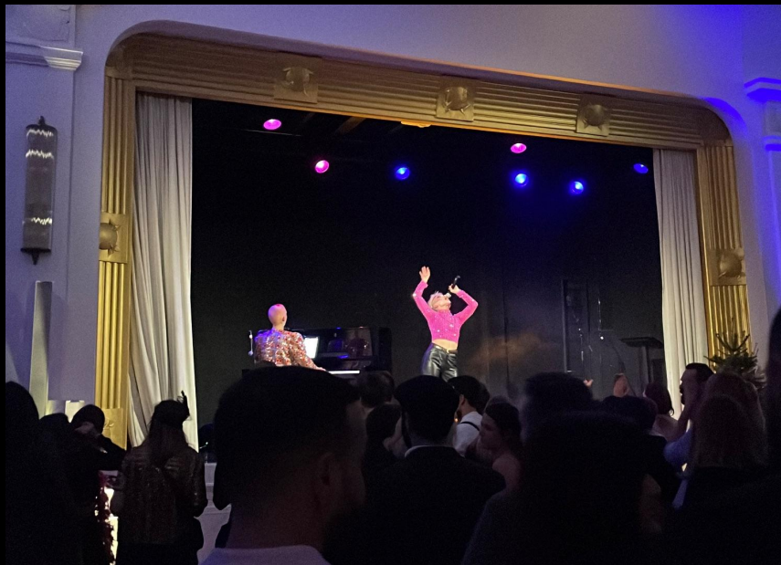
Soirée pour le CE de TIKTOK Le Solaris (La Mulette & Power Beautom)