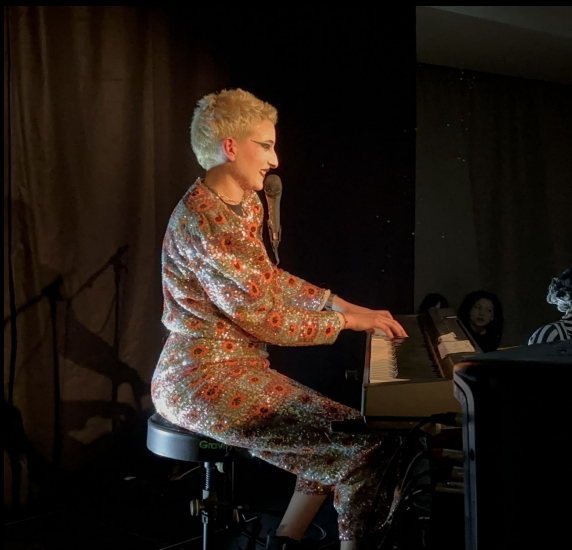
Concert Hôtel Rochechouart (La Mulette)