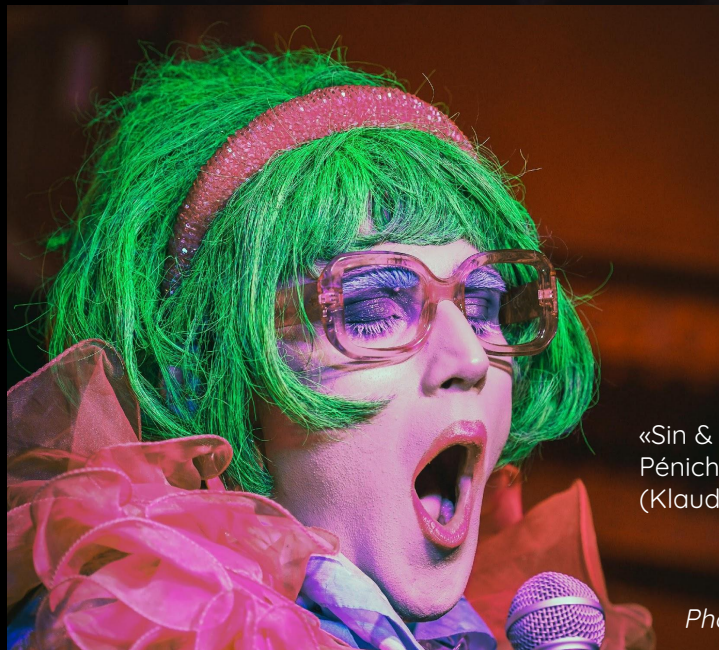
« Sin & Seine » à la Péniche Marcounet (Klaude)