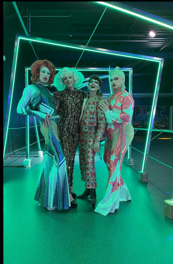
« Drag & Roll » (La Mulette, Fürsy, Rose Tental et Vivian du Fermoir de Monsac)