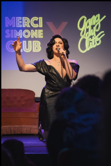
Marché de Noël Féministe Collectifs Merci Simone / Gang du Clito