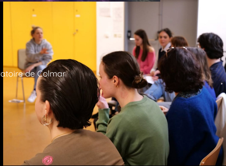
Atelier au conservatoire de Colmar Février 2025