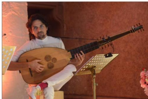
Jouer de la musique contemporaine avec des instruments anciens, un exercice d'équilibriste.