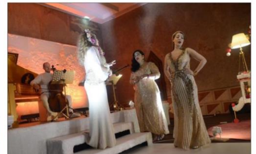
Le répertoire propose un large panorama de chants à trois voix, anciens et modernes, sans ordre chronologique mais avec une certaine cohérence musicale et esthétique.