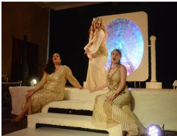
Uranie, Erato et Thalia, les trois divas déjantées du Babylon cosmos tour.