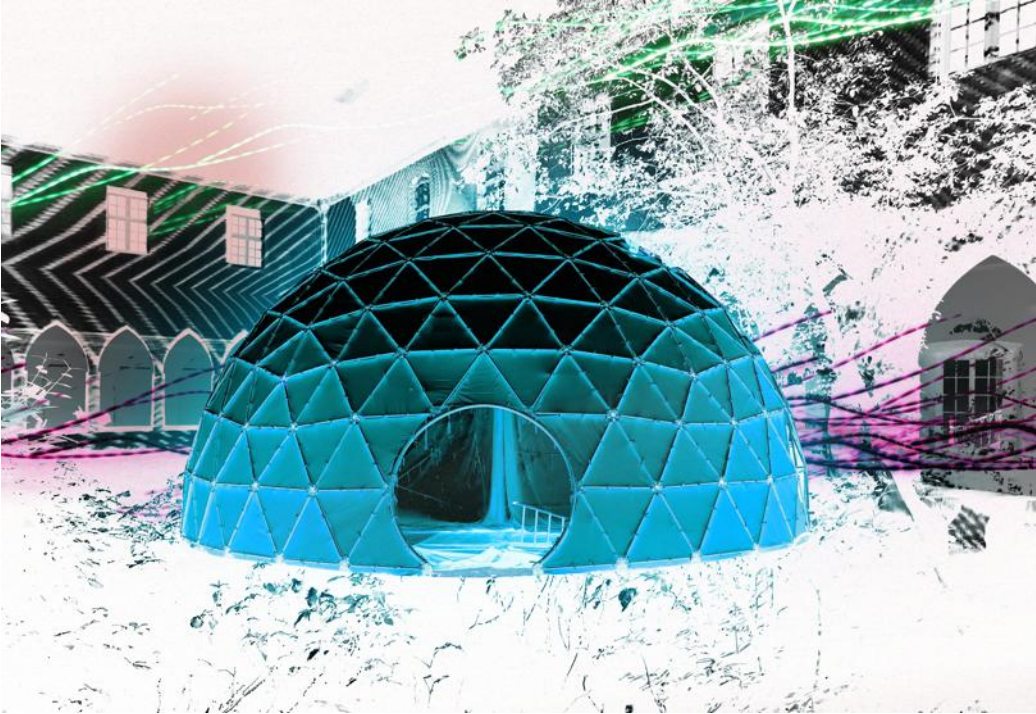
Nuits de l'exosphère, samedi 13 mai.

» Pour retrouver la programmation complète : www.les-dominicains.com tandis que la billetterie est ouverte dès à présent, et du mardi au vendredi de 14 h à 17 h (0389622182 et billetterie@les-dominicains.com )