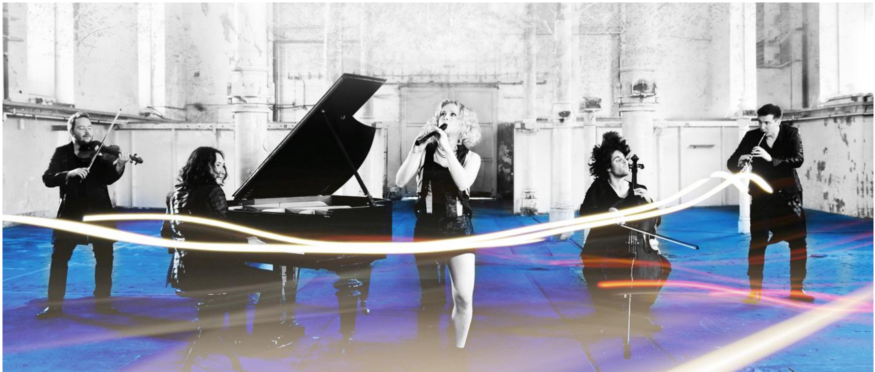
Spark the classical band, vendredi 10 février.