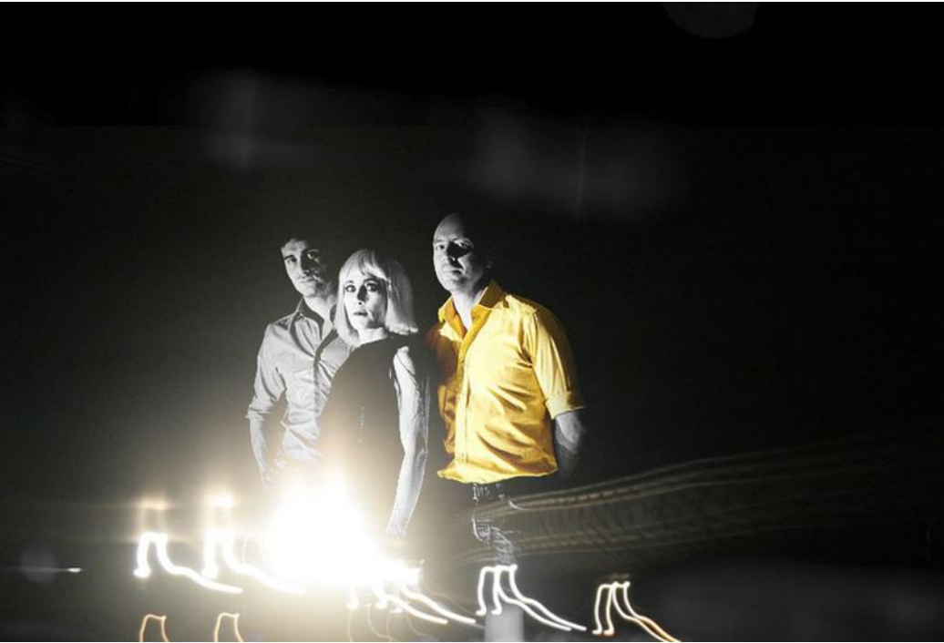
POLAROID3, vendredi 31 mars.

tembre prochain avec le concert « Les mondes futurs » autour du film de Menzies de 1936 avec les musiciens de Neirda & Z3RO, issus de la scène electro. « Le film est intéressant parce qu'il s'agit d'une représentation de l'an 2000 qui date de 1936, le public sera convié à le voir dans la nef et allongé ». Dans un tout autre registre, les Dominicains ac-