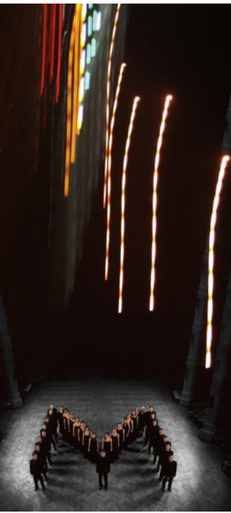
O Sacrum Convivium, vendredi 14 avril.

GUEBWILLER La nouvelle saison des Dominicains de Haute-Alsace