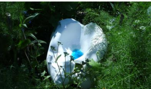
« Icebergs », œuvre céramique et sonore.