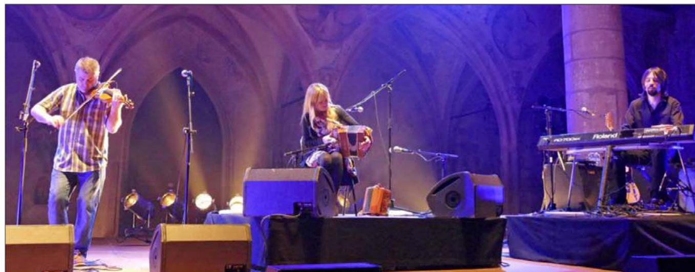
Ambiance garantie pour cette soirée irlandaise au programme varié.