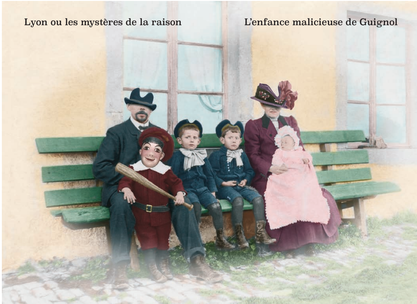
L'enfance malicieuse de Guignol