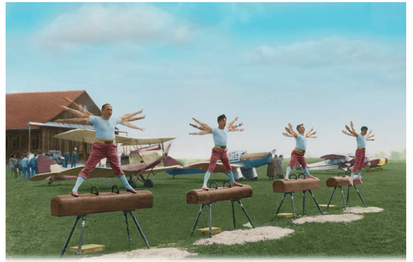
Lyon, les pionniers de l'aviation à l'entraînement