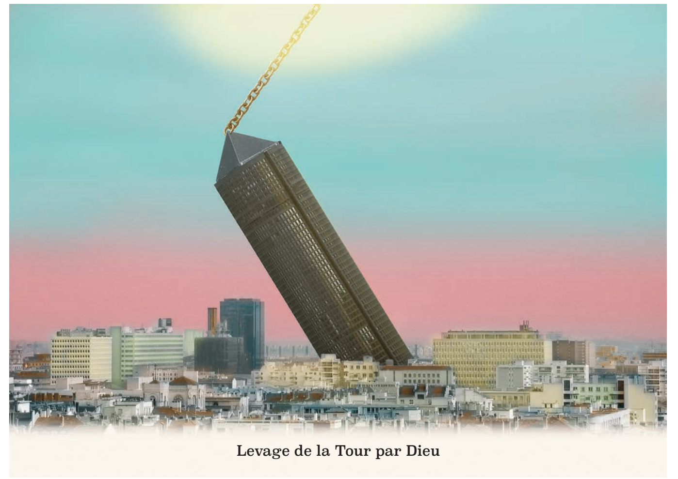
Levage de la Tour par Dieu