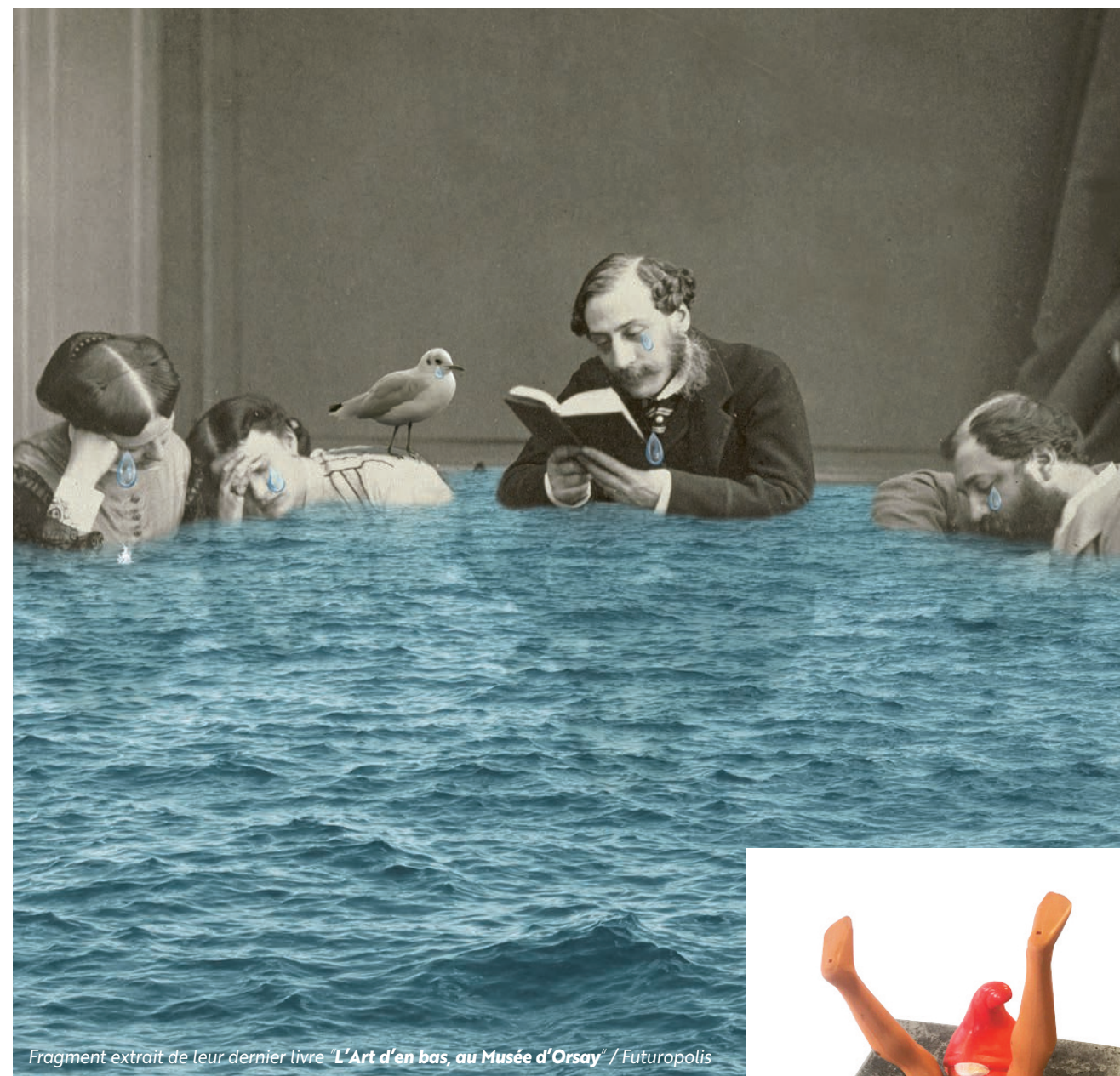
Fragment extrait de leur dernier livre "L'Art d'en bas, au Musée d'Orsay" / Futuropolis

PLONK & REPLONK a encore frappé. Labo City Magazine a invité dans ses pages cette incroyable fabrique à images (en papier, video, 4D...). On se noie volontiers de joie à leur lecture !