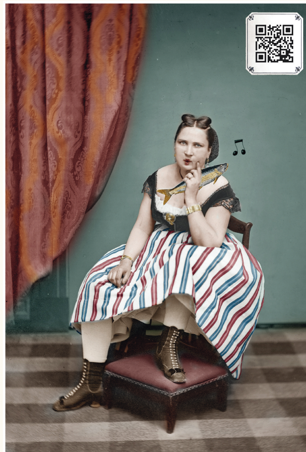
La Marseillaise, du bout des lèvres.