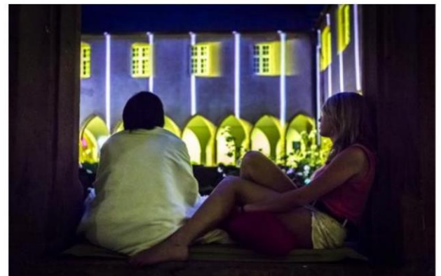
Les nuits 3D : un moment d'émerveillement et de détente.