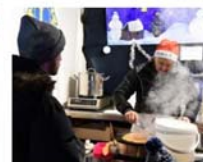
Crêpes et vin chaud sur le stand du Lions club de Guebwiller.