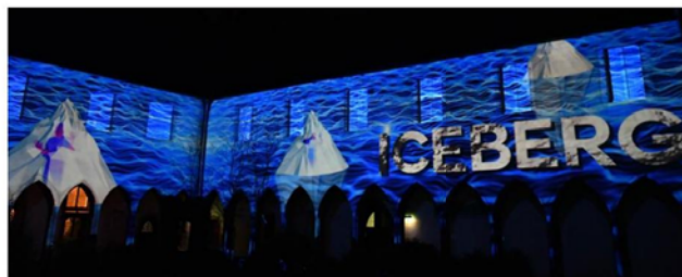
Mapping «Iceberg» aux Dominicains.