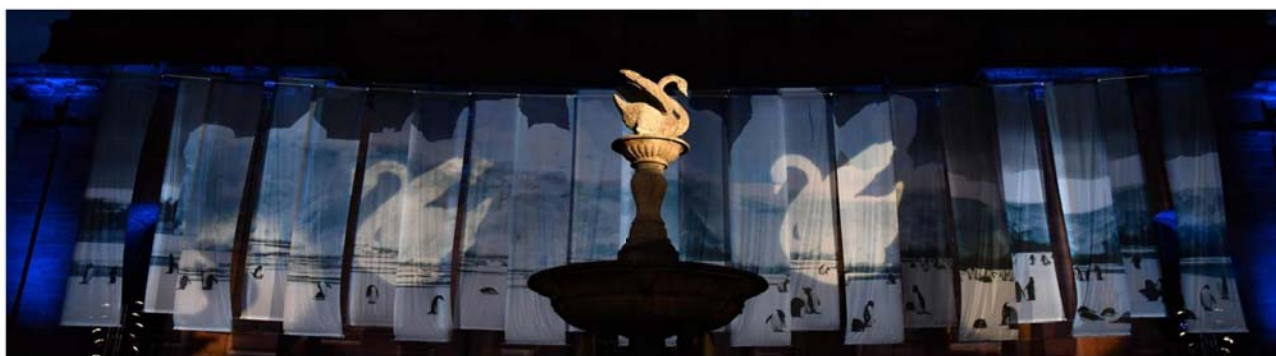
La place Jeanne-d'Arc et l'exposition Immersion.