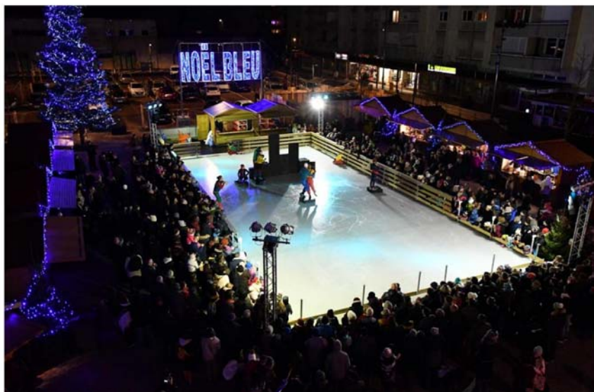
La patinoire au cœur de la ville...

► Cave diamière : marché du Lion's club les samedis et dimanches 2 et 3, 9 et 10, 16 et 17 décembre, de 14 h à 20 h.