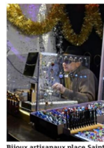
Bijoux artisanaux place Saint-Léger.