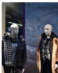
Noël Bleu se donne également à voir dans une vingtaine de commerces.