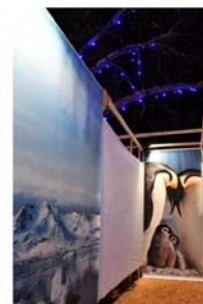
Le labyrinthe place Saint-Léger.