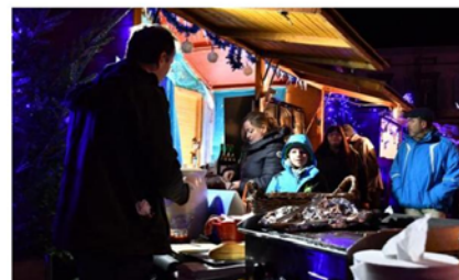
Au bonheur (culinaire) des petits et des grands.