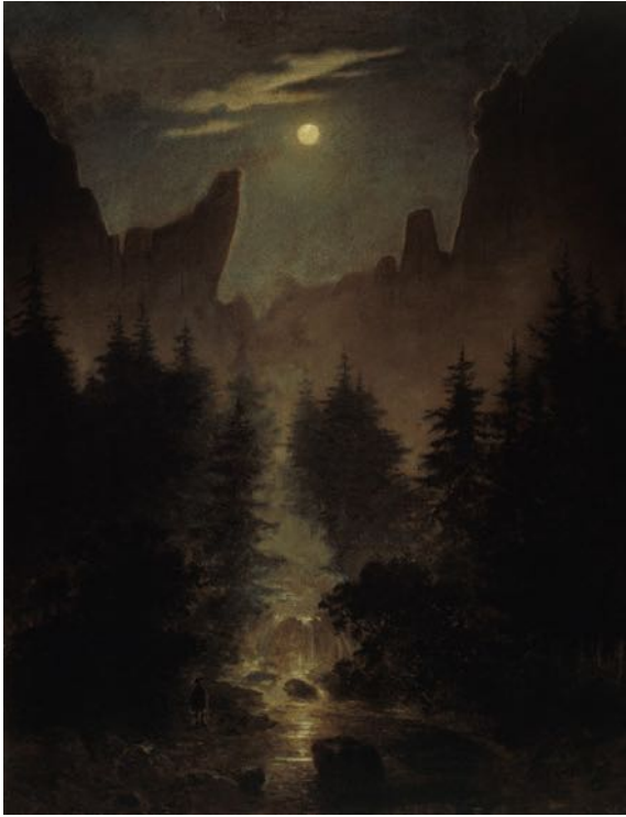
Uttewalder Grund Caspar Friedrich

Es tanzen Mond und Sterne Den flücht'gen Geisterreih'n: Wer wird von Erdensorgen Befangen immer seyn!