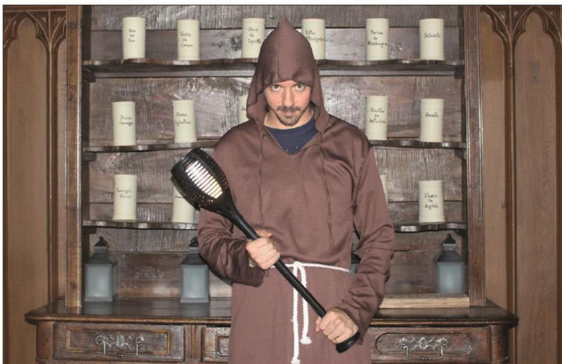
Le Game master attend les visiteurs pour trouver la relique sacrée dans l'Escape Game médiévale des Dominicains de Haute Alsace à Guebwiller.

L'équipe de La Loge du Temps propose un Escape Game (jeu d'évasion) éphémère jusqu'au 1 er septembre, aux Dominicains de Haute Alsace à Guebwiller. Dans un décor médiéval, les participants devront trouver un document sacré et échapper aux Suédois.