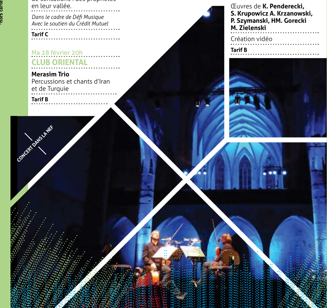
*hors carte 10/10