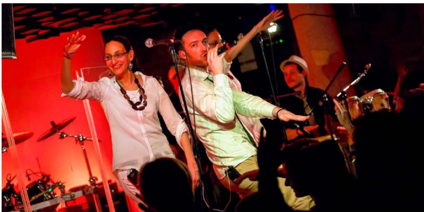
punchy, les musiciens juste sortis de leur résidence artistique.