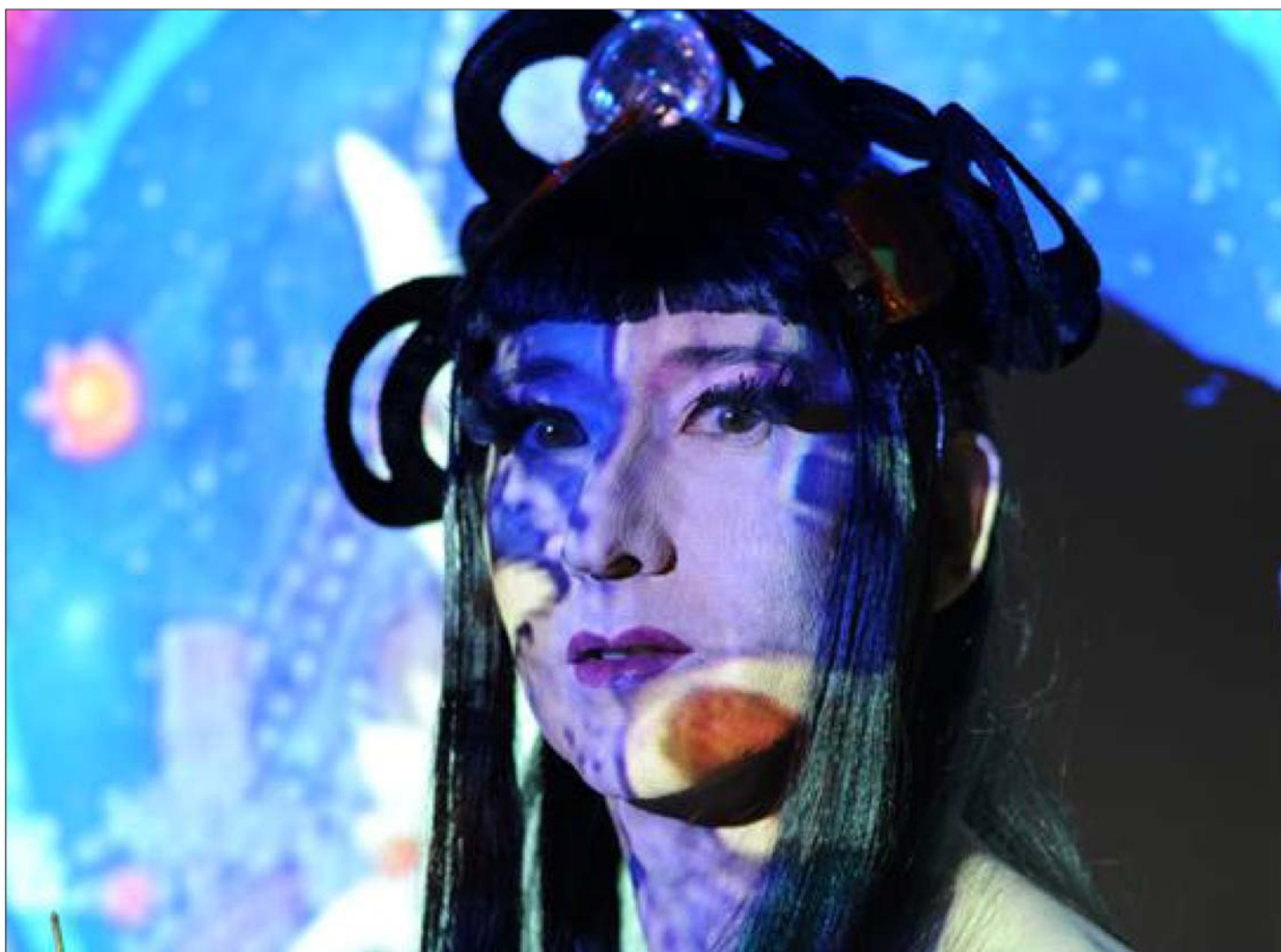
À l'affiche de ce Klassik lounge 2.0, la « chanteuse cosmique » Greta Gratos, une diva détonante aux influences électro.