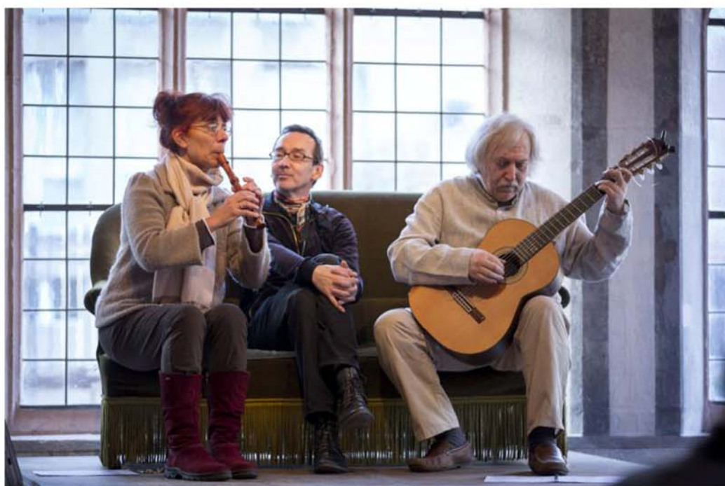
Dernières répétitions dans le Réfectoire d'été.

Être moderne sur le fond comme sur la forme, pour s'ouvrir à un horizon illimité, où tout