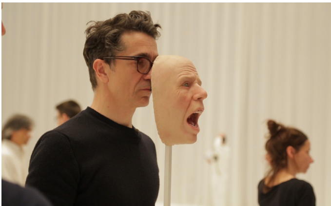
Theatron de Giulio Boato © La Compagnie des Indes