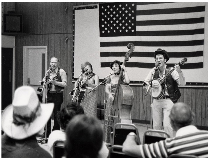
Sinai Field Mission de Frederick Wiseman