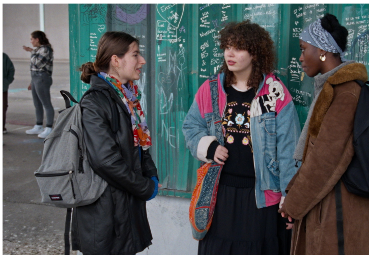
1996 ou les malheurs de Solweig de Lucie Bonteteau