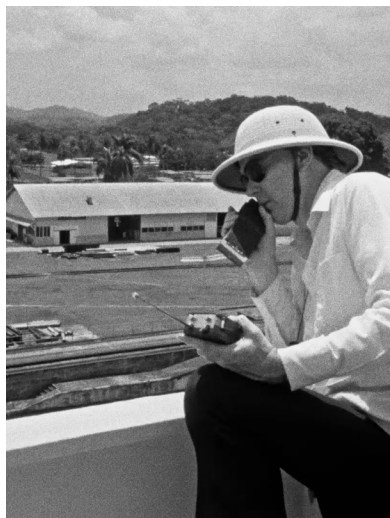
Canal Zone de Frederick Wiseman

Cinéaste américain né en 1930 à Boston, Frederick Wiseman est diplômé en droit à la Yale Law School. Il affirme dès son 1 er film documentaire, Titicut Follies en 1967, ses principes de base : l'absence d'interviews, de commentaires off et de musiques additionnelles. Le montage, qu'il effectue lui-même, est une étape importante du processus de création de ses films et dure en général 12 mois. Il a réalisé 44 films documentaires (et 2 fictions) qui composent un portrait mosaïque de la société contemporaine des États-Unis, et de ses institutions. Une véritable conscience du politique traverse cette œuvre essentielle que l'on peut sans aucun doute considérer comme « un seul et très long film qui durerait plus de 100 heures » comme il le dit lui-même.