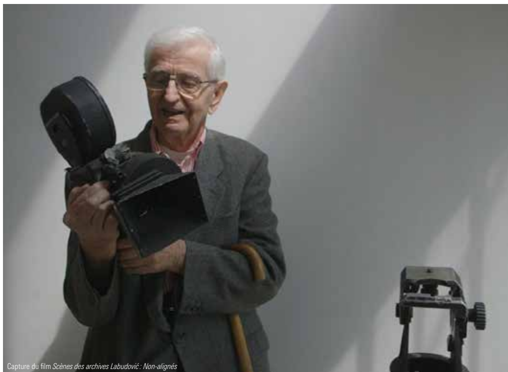
Capture du film Scènes des archives Labudović : Non-alignés