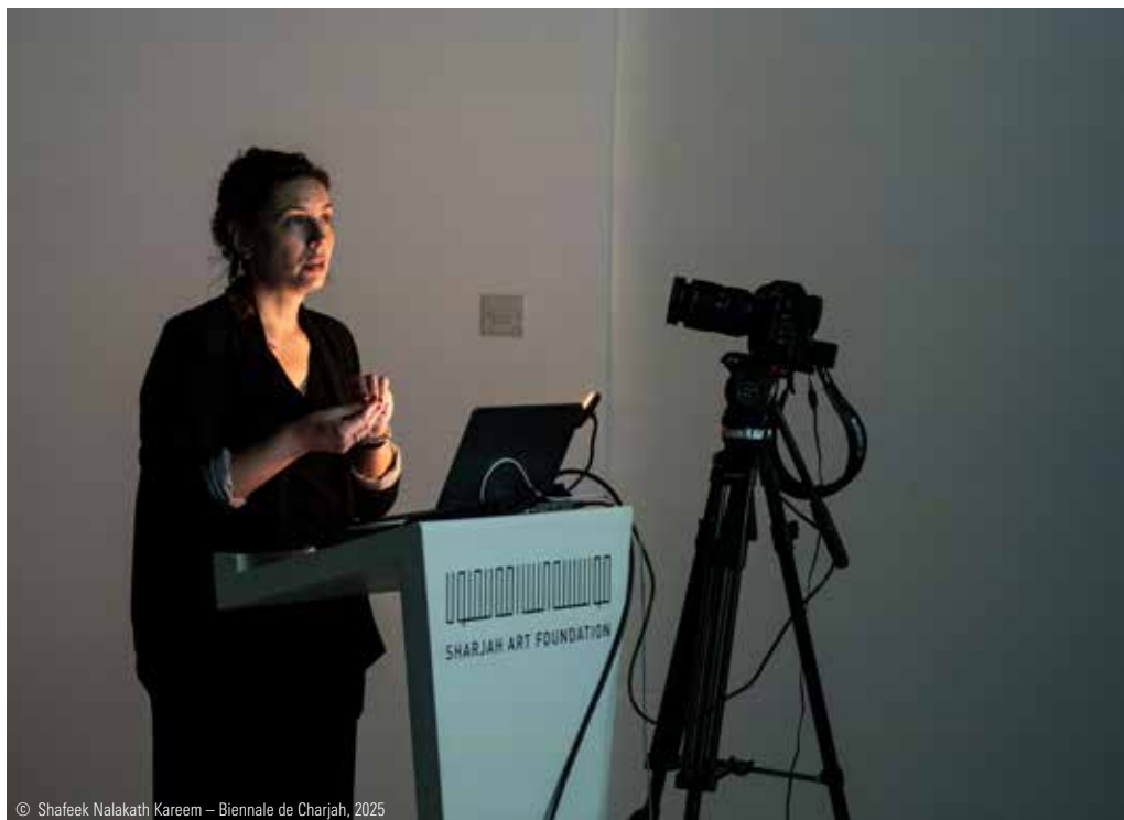
© Shafeek Nalakath Kareem — Biennale de Charjah, 2025