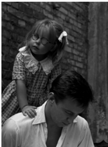
Le Quartier du corbeau de Bo Widerberg