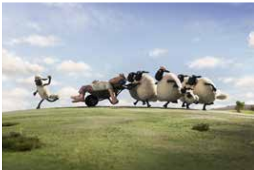
Shaun le mouton : le film

Studio d'animation britannique situé à Bristol, Aardman a été fondé en 1972. Il est reconnu pour son utilisation de la technique du stop-motion et plus particulièrement celle de l'animation de pâte à modeler. Le studio est notamment célèbre pour ses personnages Wallace et Gromit ainsi que des personnages dérivés dont Shaun le mouton. On doit aussi au studio le long métrage Chicken Run (2000), Les Pirates ! Bons à rien, mauvais en tout (2012) ou Cro Man (2018).