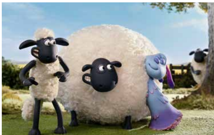
Shaun le mouton : la ferme contre-attaque