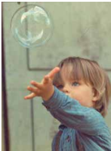
Ådalen '31 de Bo Widerberg