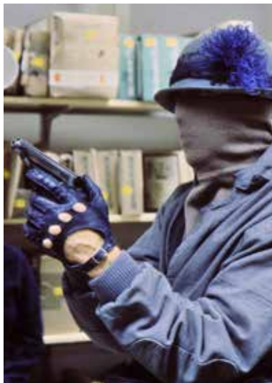
L'Homme de Majorque de Bo Widenberg