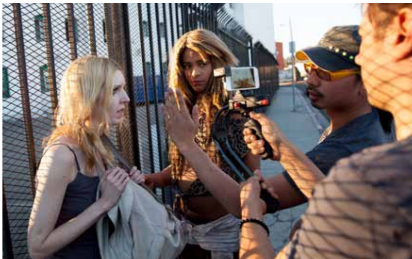
Tangerine de Sean Baker