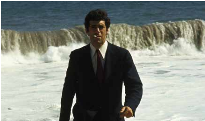
Le Privé de Robert Altman