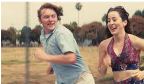
Licence Pizza de Paul Thomas Anderson