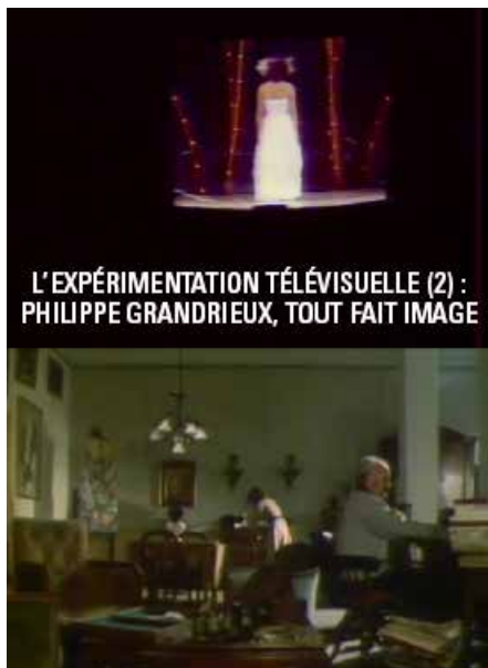
L'EXPÉRIMENTATION TÉLÉVISUELLE (2) : PHILIPPE GRANDRIEUX, TOUT FAIT IMAGE