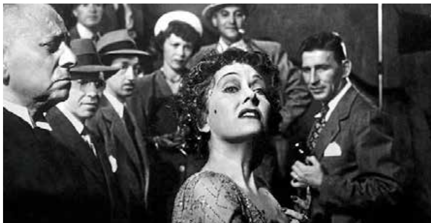
Boulevard du crépuscule de Billy Wilder