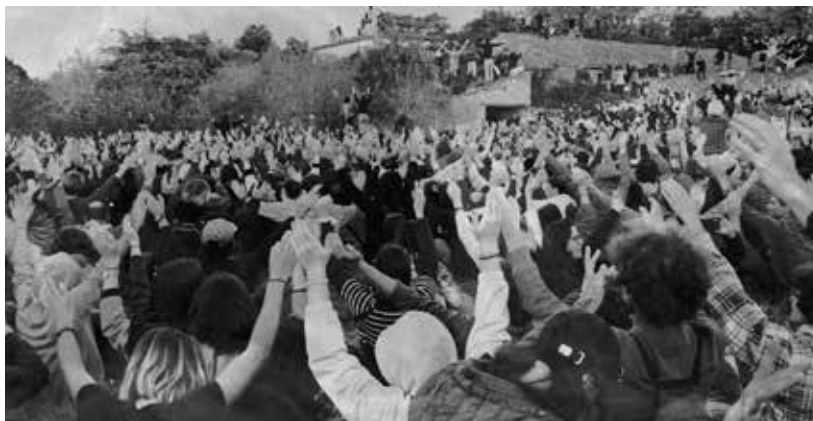
Soulèvements de Thomas Lacoste