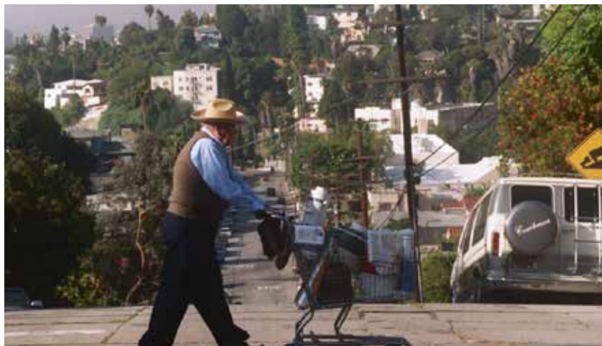
Echo Park L.A. de Richard Glatzer et Wash Westmoreland