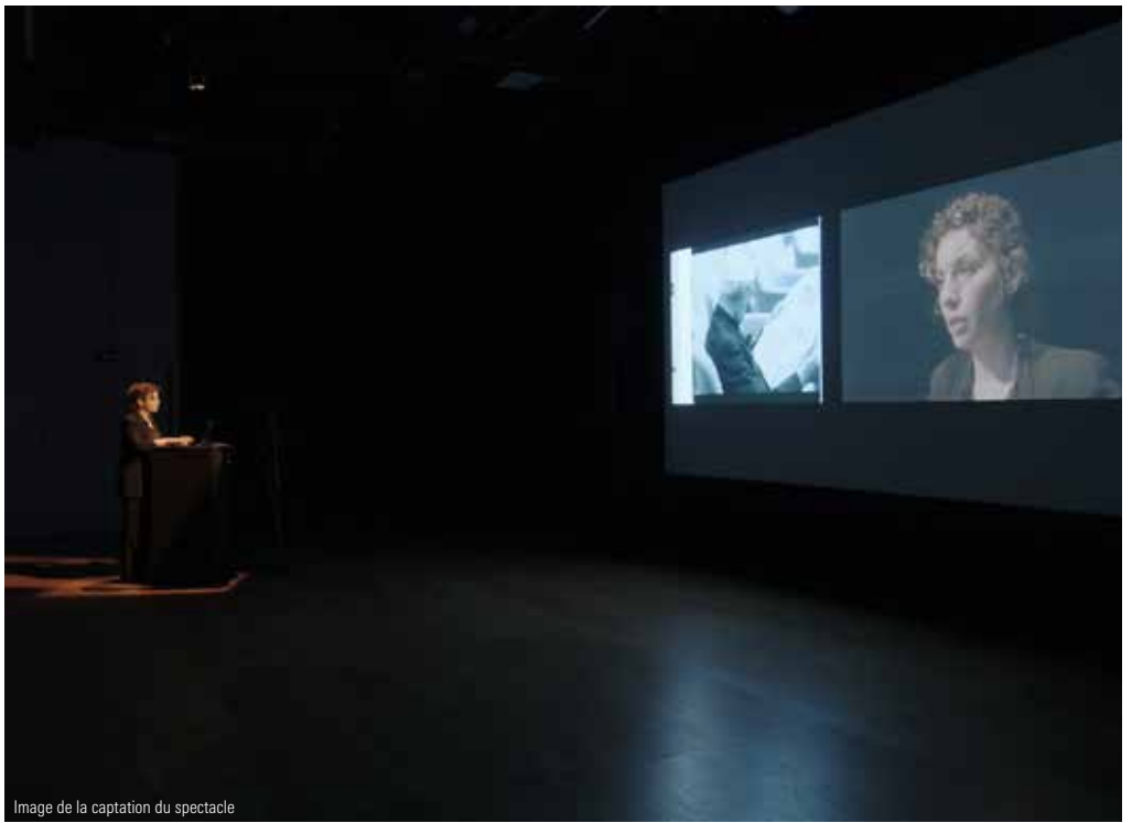
Image de la captation du spectacle