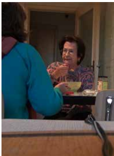
No Home Movie de Chantal Akerman