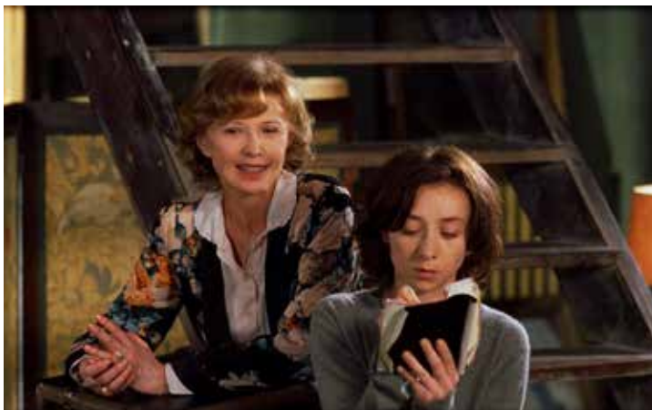
Demain, on déménage de Chantal Akerman © Capricci Films