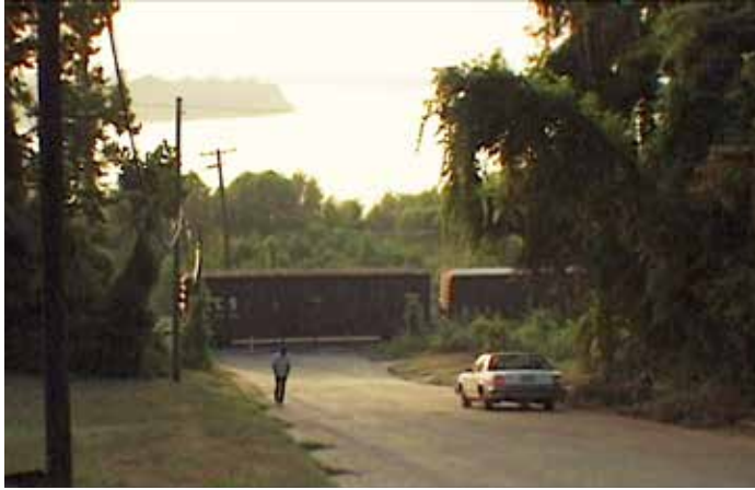
Sur de Chantal Akerman