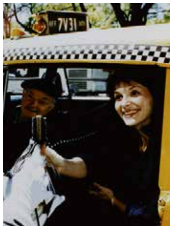
Un Divan à New-York de Chantal Akerman

Retrouvez des interviews exclusives de Chantal Akerman en introduction.