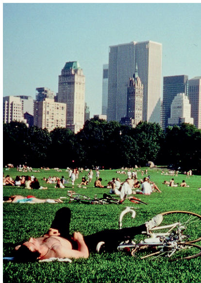
Central Park de Frederick Wiseman