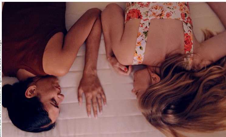
Queen Size de Avril Besson

Lors de ces 2 journées, les lycéennes et lycéens rencontrent une partie des écrivain-es de la sélection Goncourt, des académicien-nes et des professionnel-les des métiers du livre. Des activités autour de l'écriture et de la lecture ainsi que des ouvertures vers d'autres formes d'expression leur sont également proposées.