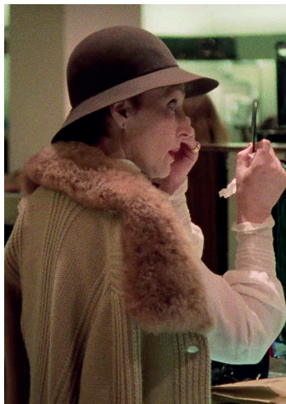
The Store de Frederick Wiseman

Cinéaste américain né en 1930 à Boston, Frederick Wiseman est diplômé en droit à la Yale Law School. Il affirme dès son 1 er film documentaire, Titicut Follies en 1967, ses principes de base : l'absence d'interviews, de commentaires off et de musiques additionnelles. Le montage, qu'il effectue lui-même, est une étape importante du processus de création de ses films et dure en général 12 mois. Il a réalisé 44 films documentaires (et 2 fictions) qui composent un portrait mosaïque de la société contemporaine des États-Unis, et de ses institutions. Une véritable conscience du politique traverse cette œuvre essentielle que l'on peut sans aucun doute considérer comme « un seul et très long film qui durerait plus de 100 heures » comme il le dit lui-même.