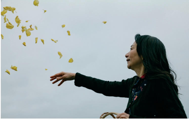
Tout ira bien de Ray Yeung