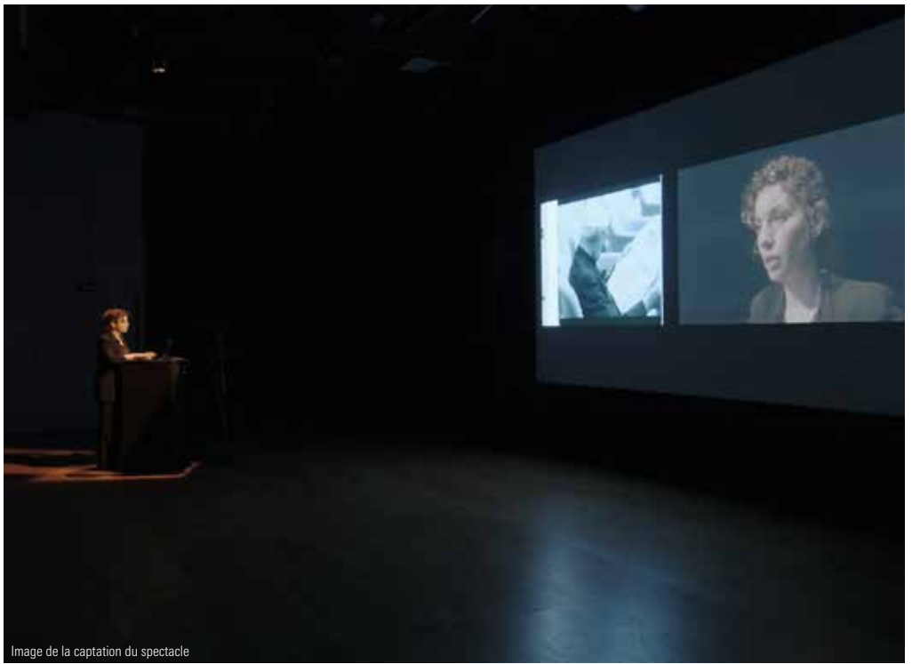
Image de la captation du spectacle