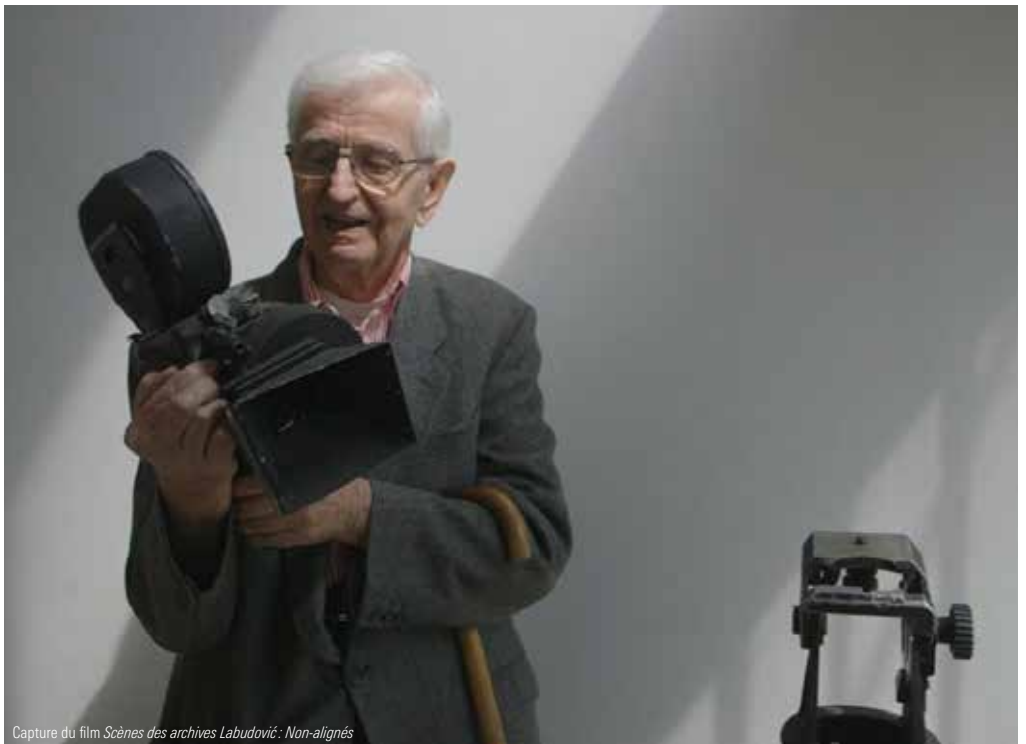
Capture du film Scènes des archives Labudović : Non-alignés