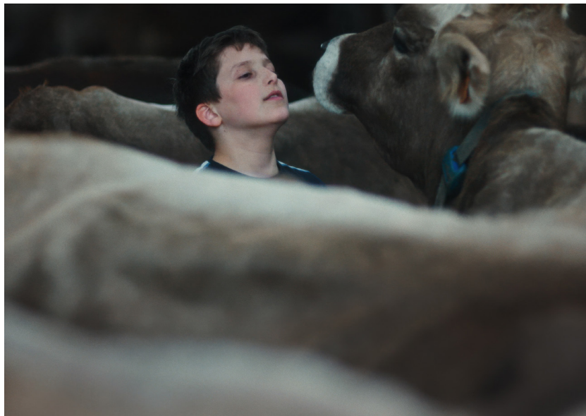
Gabin de Maxence Voiseux