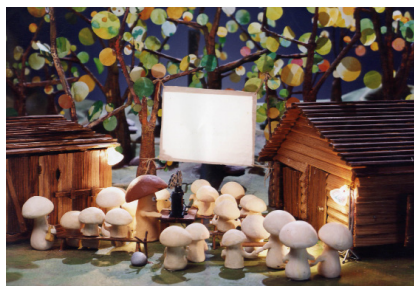
Capelito fait son cinéma de Rodolfo Pastor © Les Films du Whippet

Capelito, le petit champignon des bois, a tout d'un vrai génie: distrait, créatif et plein de malice, il trouve des solutions à tous les problèmes. Dans ces épisodes, il met au service des arts son petit nez magique pour devenir tour à tour cinéaste, danseur, chanteur, bref un vrai artiste.