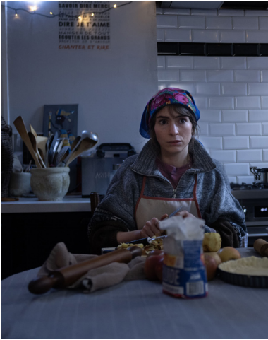
Le Journal d'une femme de chambre de Radu Jude