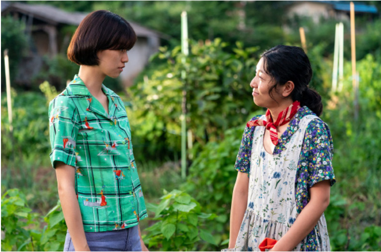
Dora de July Jung