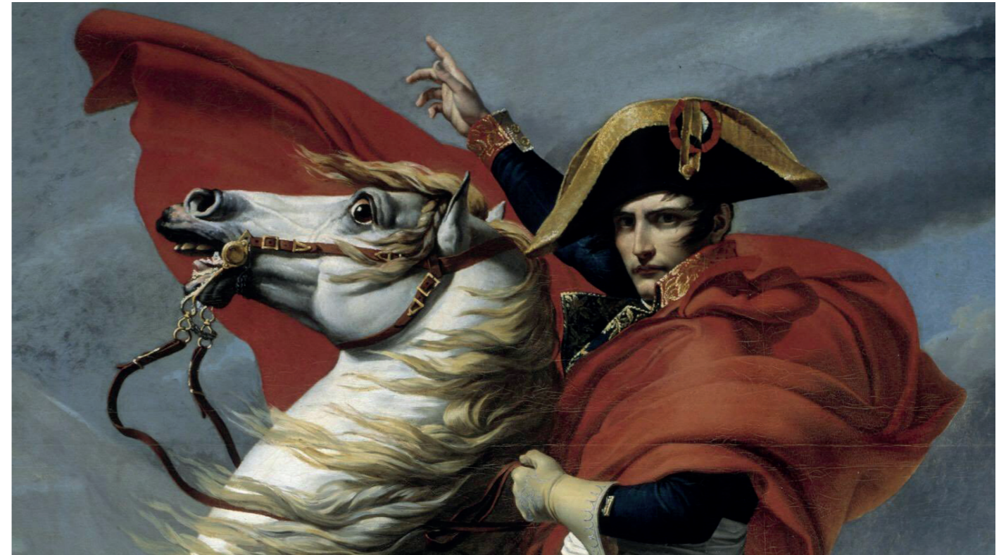
Jacques-Louis David, Bonaparte, Premier consul, franchissant le Grand-Saint-Bernard, le 20 mai 1800 (détail), 1802, Versailles, musée national des châteaux de Versailles et de Trianon