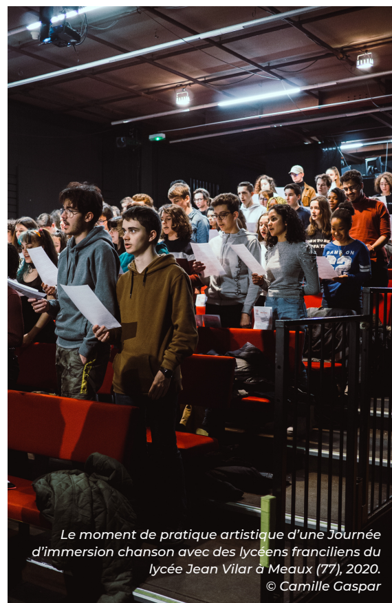
Le moment de pratique artistique d'une Journée d'immersion chanson avec des lycéens franciliens du lycée Jean Vilar à Meaux (77), 2020.

La chanson, de tous temps marqueur social, sociétal et historique, permet la compréhension d'une époque : les lycéen.e.s, par cette immersion, y sont sensibilisés. Ce dispositif favorise les échos avec les programmes scolaires, mais se veut assez souple vis-à-vis des thématiques abordées et essaiera de s'adapter aux besoins et attentes des enseignants et de leurs élèves.