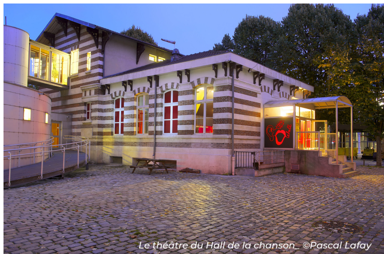
Le théâtre du Hall de la chanson