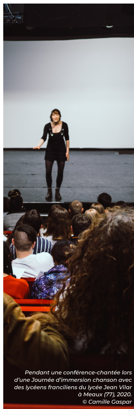
Pendant une conférence-chantée lors d'une Journée d'immersion chanson avec des lycéens franciliens du lycée Jean Vilar à Meaux (77), 2020.