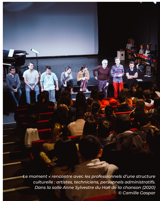
Le moment « rencontre avec les professionnels d'une structure culturelle : artistes, techniciens, personnels administratifs. Dans la salle Anne Sylvestre du Hall de la chanson (2020)

La thématique de l'après-midi est définie en concertation avec les enseignants. Si vous souhaitez nous proposer un thème à aborder avec vos élèves, n'hésitez pas à nous en faire part : nous pouvons parfois répondre à des demandes en dehors des thématiques que nous proposons.