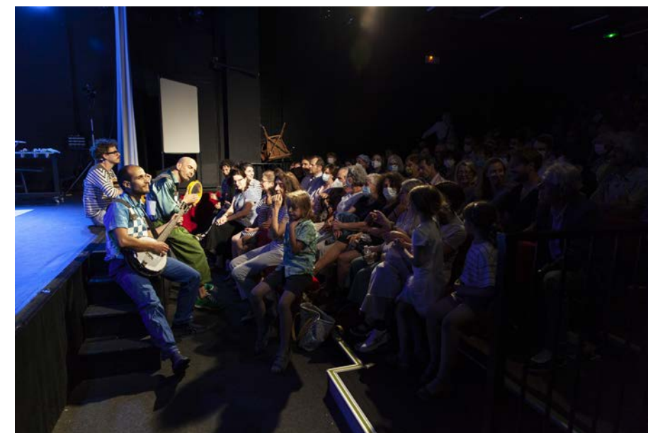
Des racines à Lapointe