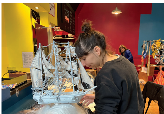
Vues de l'atelier où sont travaillés les accessoires et costumes.