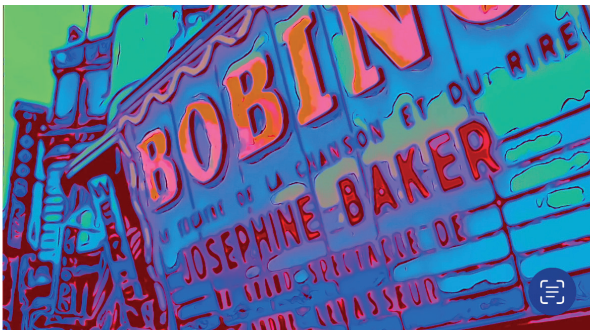
travail vidéo du décor (crédit Daniel Marino)

Ce spectacle coloré, conçu à partir de matériaux réemployés, rend hommage à la résilience et à l'inventivité de Joséphine Baker, petite fille déshéritée du Missouri, victime de la ségrégation raciale, devenu star internationale. Dès la fin de la guerre, elle entreprend progressivement l'adoption de 12 enfants venus des quatre coins du globe, formant ce qu'elle appelait sa « tribu arc-en-ciel », symbole éclatant de respect des différences et de fraternité. De ses débuts à Saint-Louis à son ultime revue, en passant par son triomphe fulgurant à Paris dès 1925 (où elle participe à populariser le jazz afro-américain), chaque tableau de ce spectacle est une célébration de sa singularité et de sa liberté. Un voyage où la musique et la danse débordent les frontières et fêtent la diversité.