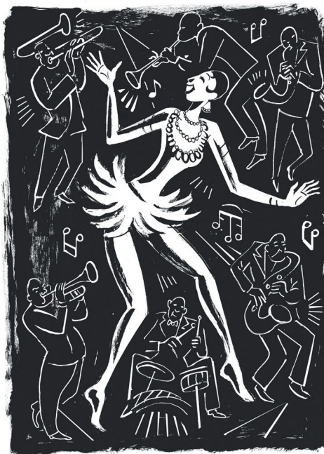
Illustration Cotel Muller

Chargée de diffusion sandrine.b.10@orange.fr