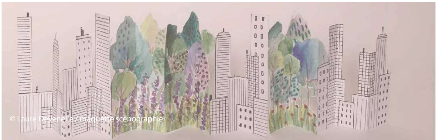
© Laure Devenelle / maquette scénographique