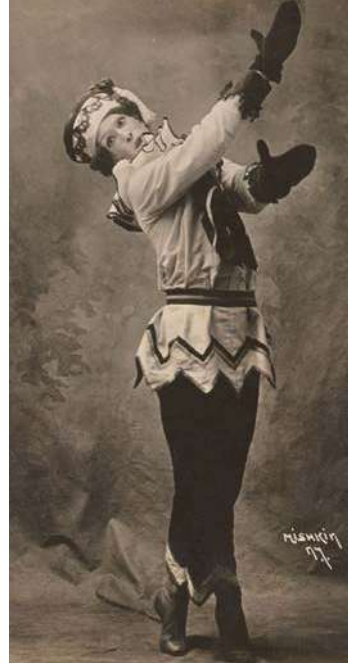
Nijinski dans le rôle de Petrouchka, photo de Herman Mishkin. Library of Congress

Les trois personnages principaux du conte constituent le Trio éternel de la Comédie comme dans la Commedia dell'Arte ( Pierrot, Colombine et Arlequin ) ou le drame bourgeois (le mari, la femme et l'amant).