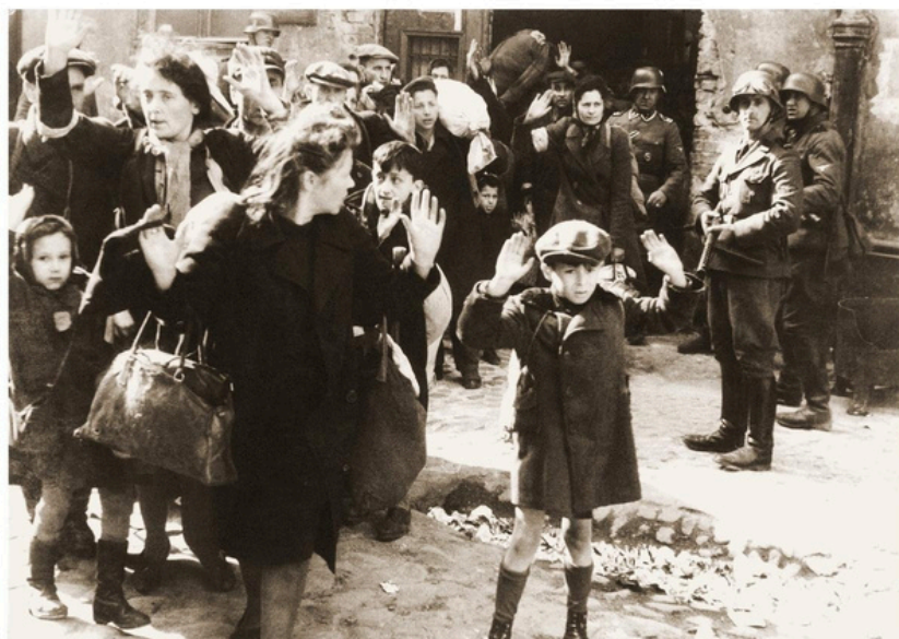
Légende : « Forcés hors de leur trou »