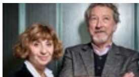
Ariane Ascaride et Robert Guédiqian

Parcours autour de l'œuvre de Robert Guédiqian (p.15)