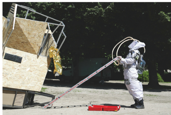
V'là © Cie Anomalie

Plus d'informations sur la programmation de la Fête des Vendanges sur bagneux92.fr