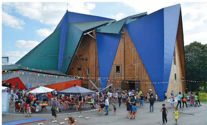
Bâtiment du Plus Petit Cirque du Monde