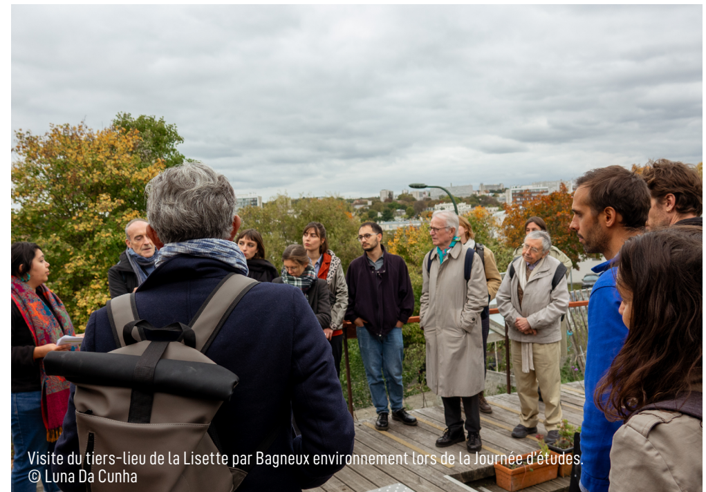
Visite du tiers-lieu de la Lisette par Bagneux environnement lors de la Journée d'études.