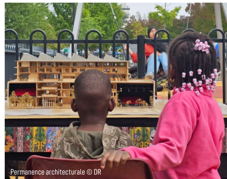
Permanence architecturale