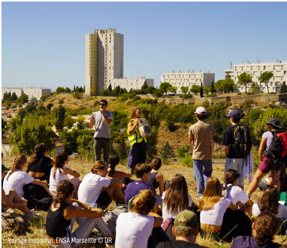
Voyage inaugural, ENSA Marseille