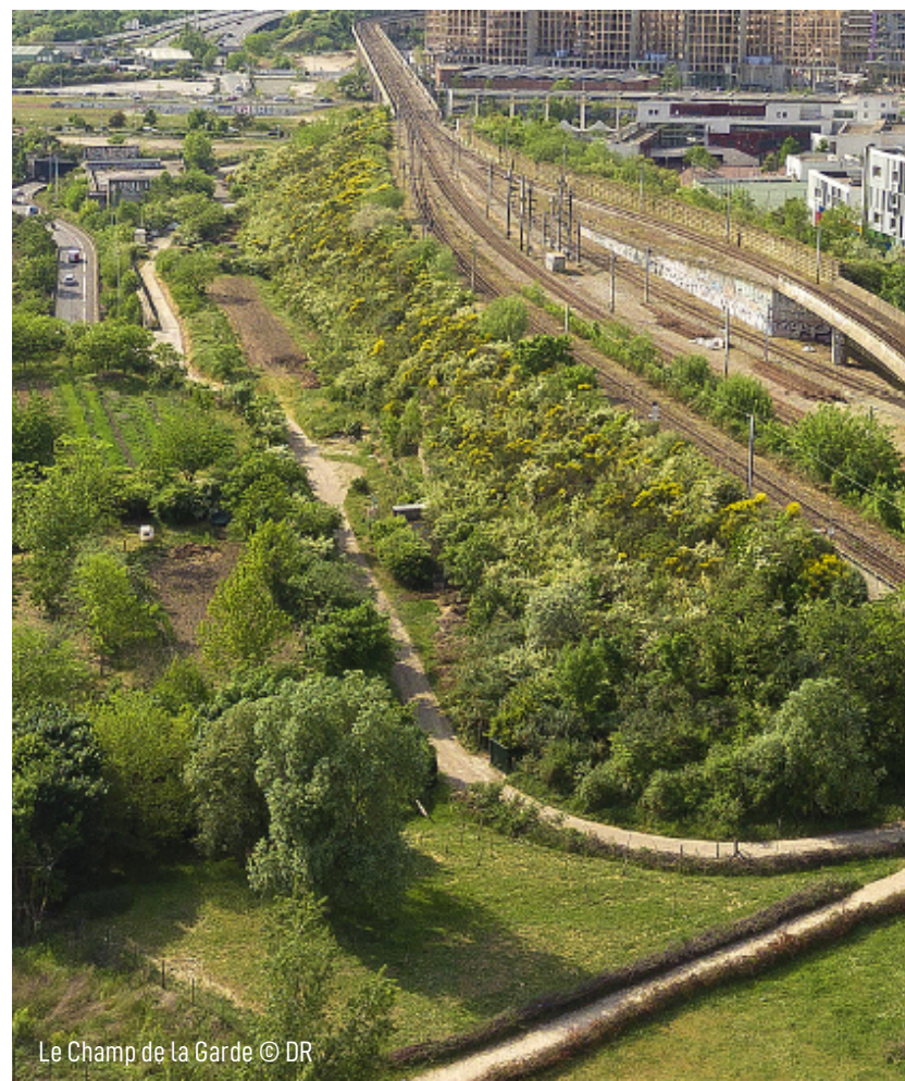
Le Champ de la Garde

À l'heure où la ZAC Seine-Arche entre dans une phase de finalisation et où le site connaît de nouvelles mutations urbaines, la question posée dépasse le seul cadre foncier : elle concerne la reconnaissance d'un patrimoine agricole, paysager et social construit dans la durée. La collaboration entre la Ferme du Bonheur et Le Pré vise précisément à inscrire cet héritage dans les transformations en cours, en articulant mémoire, expérimentation et projet urbain.