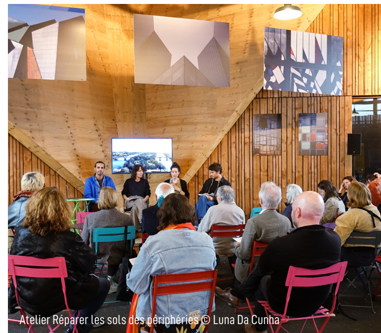
Atelier Réparer les sols des périphéries

Ces sites sont en outre soumis à une forte pression foncière, ce qui renforce l'enjeu de leur devenir.