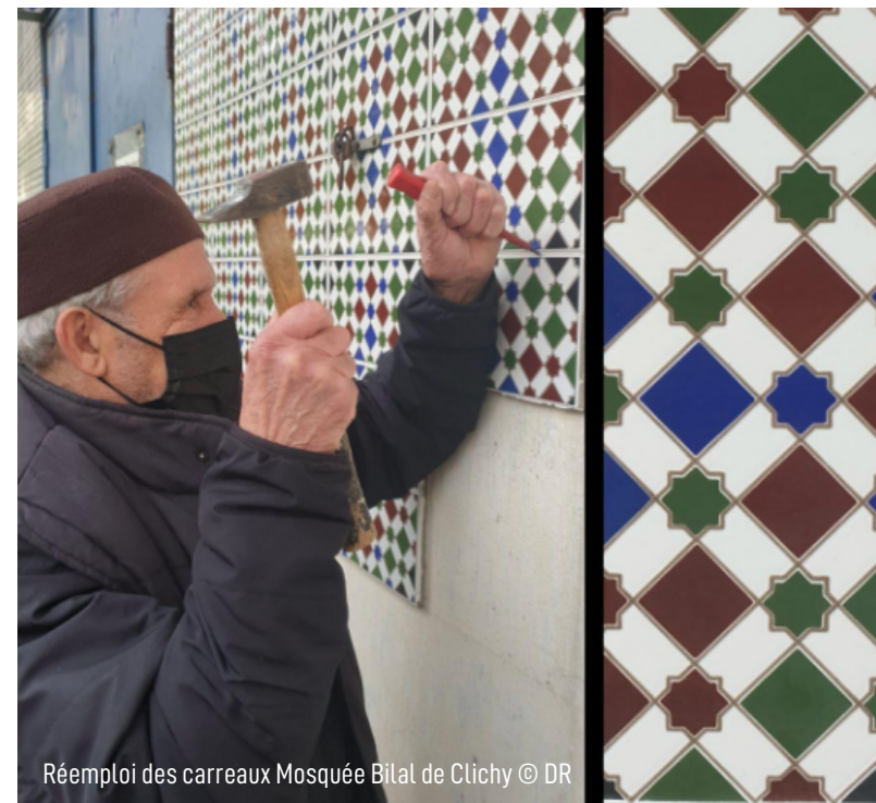
Réemploi des carreaux Mosquée Bilal de Clichy