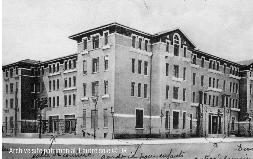
LE ARTIFICIELLE DU SUD-EST - Usine de VAULX EN-VELIN (Rhône) - Maison JEANNE