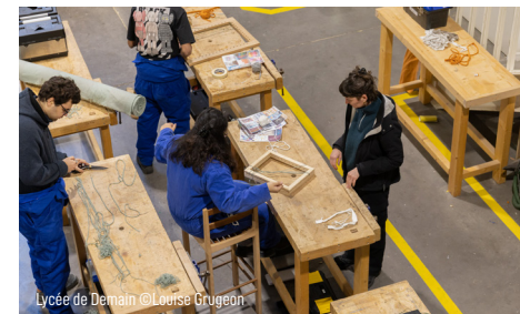
Lycée de Demain

À Bagneux, la cité du Champ-des-Oiseaux (1927-1939) de Marcel Lods et Eugène Beaudouin constitue le premier grand ensemble préfabriqué de France. Reconnue comme cité-jardin aux qualités urbaines remarquables, elle fait l'objet d'une réhabilitation visant à retrouver son état initial. Les habitant-es devront quitter la cité avant le démarrage des travaux. Cette phase de relogement, potentiellement difficile, ouvre l'opportunité d'un projet de permanence artistique, architecturale et citoyenne accompagnant le départ des habitant-es, collectant leurs mémoires, et préfigurant les usages futurs.