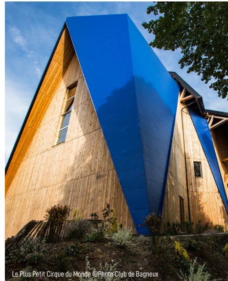
Le Plus Petit Cirque du Monde

À travers la mobilisation des pratiques artistiques, de l'architecture, de la sociologie et de l'urbanisme, ce programme nous aide à penser le monde de demain dans les périphéries, à accompagner la transformation des banlieues en territoires d'imagination et de vitalité culturelle, à renforcer leur attractivité économique et touristique et à en faire des zones de fabrication prioritaire des patrimoines et de l'architecture de demain.