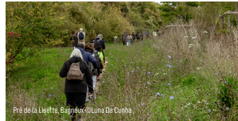
Pré de la Lisette, Bagneux.

Par la marche, ce rendez-vous annuel invite à voir ce que l'on ne regarde pas d'ordinaire, à emprunter des chemins alternatifs et à découvrir les villes invisibles, en compagnie d'habitant-es, d'acteurs du territoire et d'expert-es en architecture et urbanisme. Le parcours est ponctué de rendez-vous artistiques inattendus offrant une lecture poétique, sensible et créative des patrimoines qui composent les périphéries urbaines.