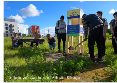
Terrain du Lycée avant le lycée

En menant des projets qui donnent aux habitants une place active dans les transformations urbaines qui les concernent directement, nous expérimentons dans les villes de banlieue, des réponses aux urgences sociales et environnementales et aux nombreuses fractures économiques et culturelles des quartiers populaires périphériques.