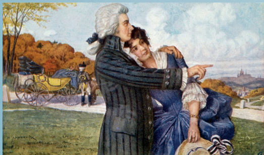
Mozart et Constanze en voyage de noces.

La messe restera inachevée mais sera bien donnée l'année suivante, Constanze prêtant sa voix au sublime «Laudamus». Sur le chemin du retour, Mozart fait étape à Linz chez le comte Thun. Il souhaite le remercier par un concert mais n'a pas de partitions sur lui. Qu'à cela ne tienne: il écrit une symphonie en cinq jours – et ce sera l'une de ses plus belles.