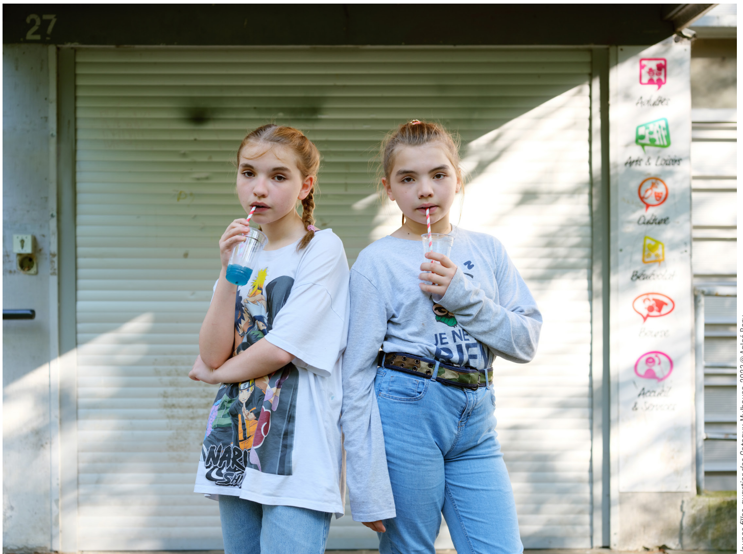
Jeunes filles - quartier des Coteaux, Mulhouse, 2023

exposition photographique en entrée libre DU 22 SEPT. AU 10 NOV. 2023