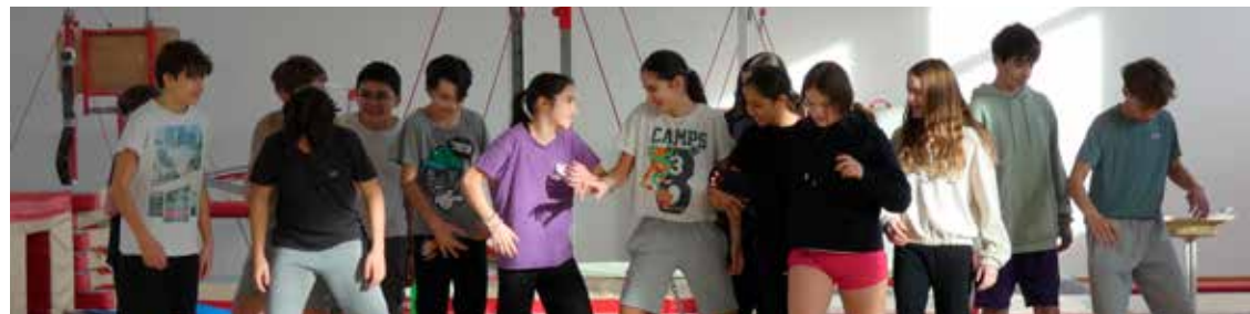
Parcours danse : Salti (collège)