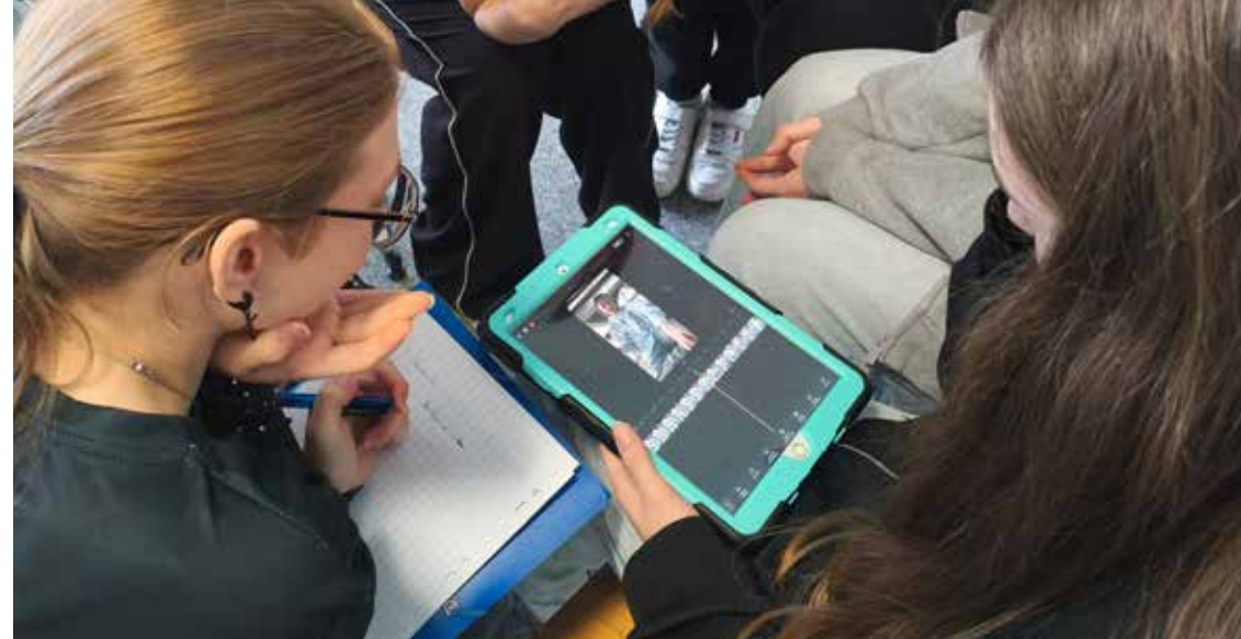
Parcours théâtre et numérique : Crari or not

Pour mener à bien cet atelier, un équipement complet a été mis à disposition : sept tablettes, micros, projecteurs, ainsi que divers outils techniques et logiciels de montage. Les élèves ont également eu accès à des filtres personnalisés à l'effigie des personnages littéraires étudiés, leur permettant de s'immerger pleinement dans leurs rôles lors des tournages.