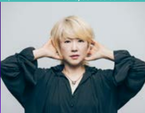
Youn Sun Nah