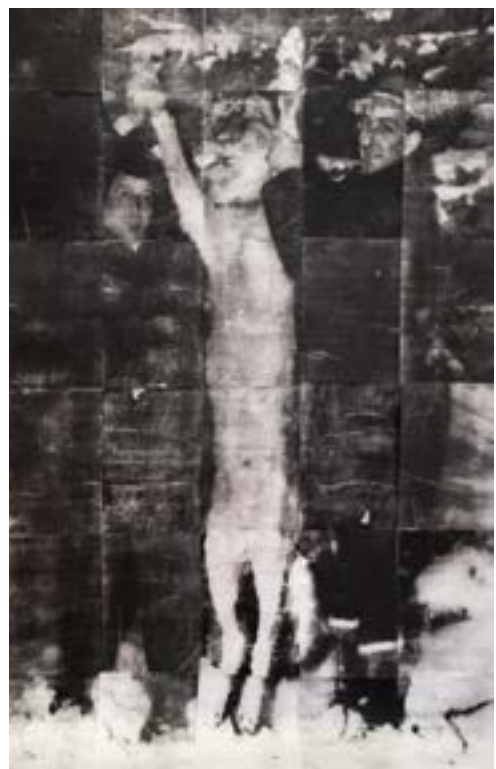
Là où poussent les ronces