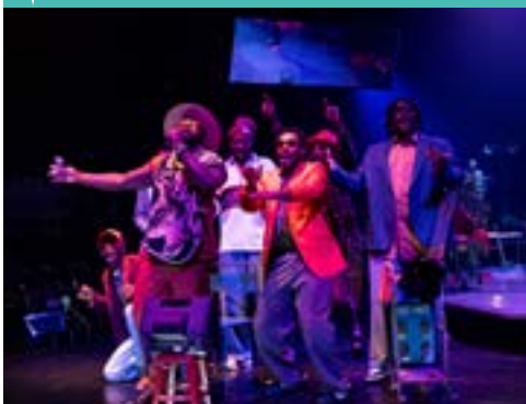
Barber Shop Chronicles