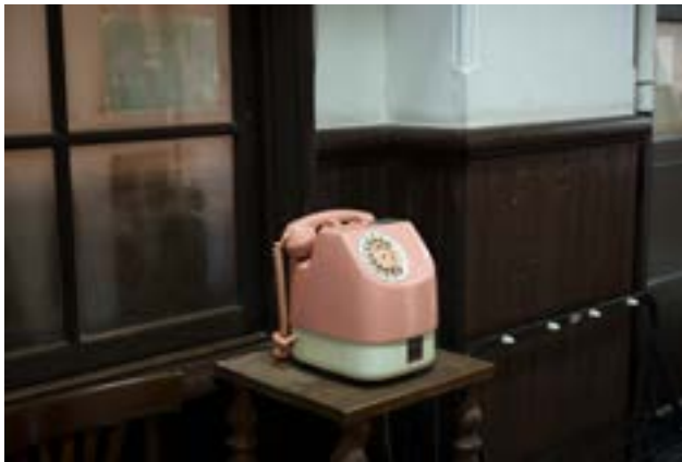
Far East © Géraldine Lay