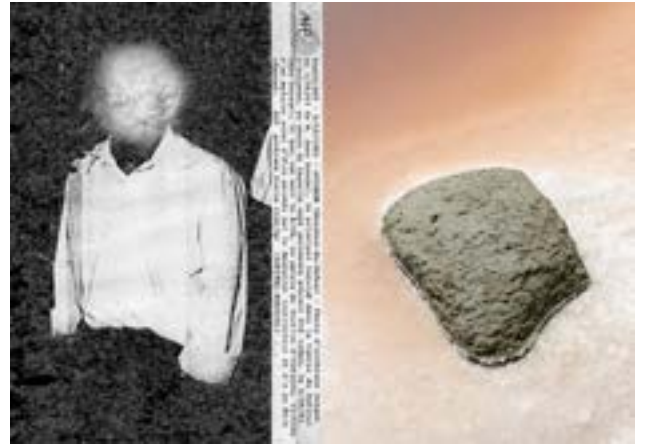
Chambre 207