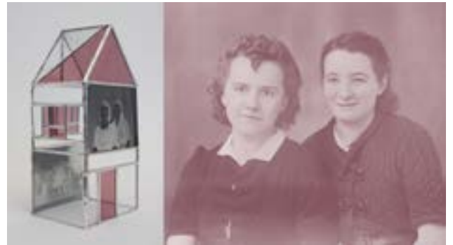
Les colocataires