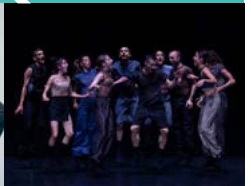
My Fierce Ignorant Step