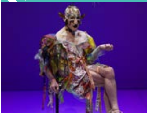
People Will People You