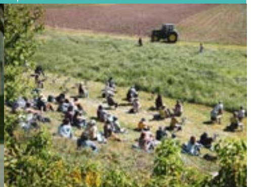
Alouettes – Pièce de champ