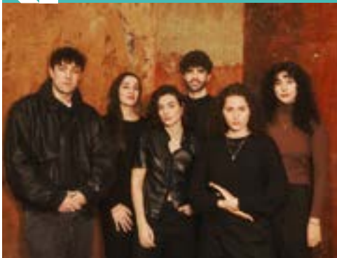
Les Voix de Carmen