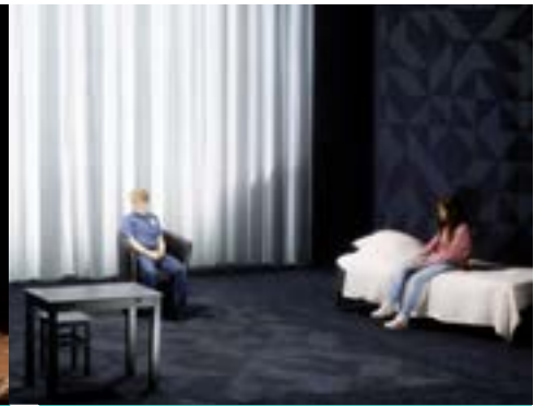
Les Petites Filles modernes (titre provisoire)