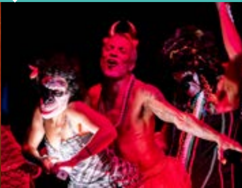
Derrière Vaval, Pleurs, cornes et fwèt.