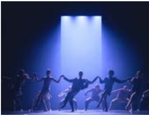
Theatre of Dreams