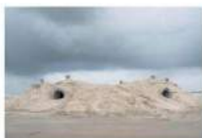
Star of the sea in Zeebrugge, ood