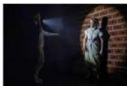
De bleke baron, pd