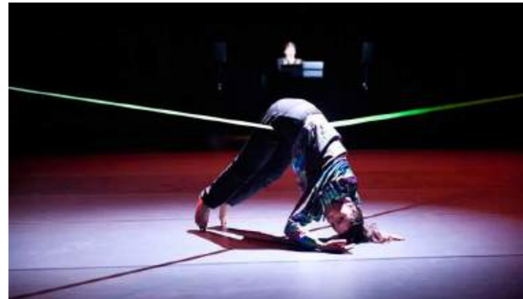
losing it de samaa wakim et samar haddad king

Par Meyssem MARROUKI Publié sur 27/04/2024