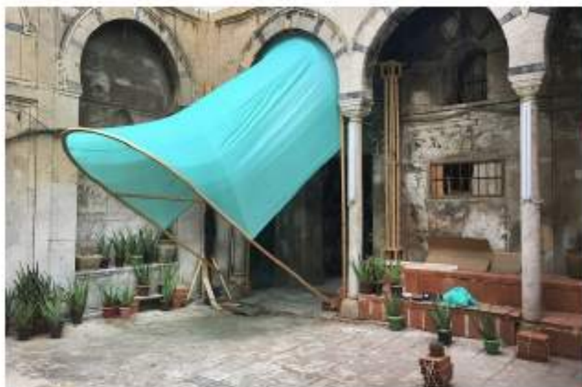
CULTURE 10:15 04/04/2024

Spring activities are blossoming all over the country! Don't miss out on these festivals, performances, exhibitions and family shows.