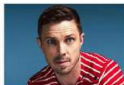
Jake Shears, rt