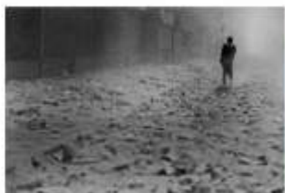
Turning point, netflix