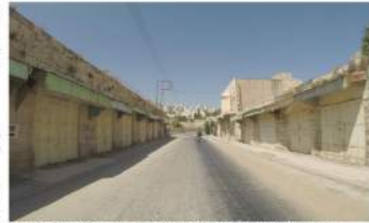
Shuhada Street: ook de drukste ader met Palestijnse winkeltjes, nu een stoffige spookstraat.