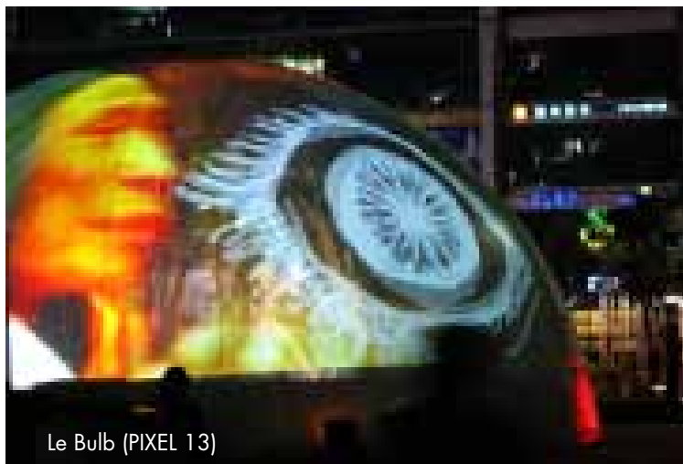
Le Bulb (PIXEL 13)