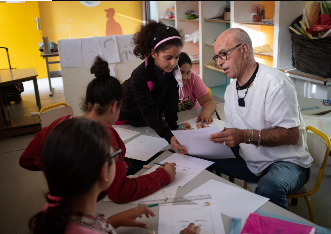
Atelier d'arts plastiques à l'école Abdelaziz Lasram dite Kottab Louzir, médina de Tunis, 2020