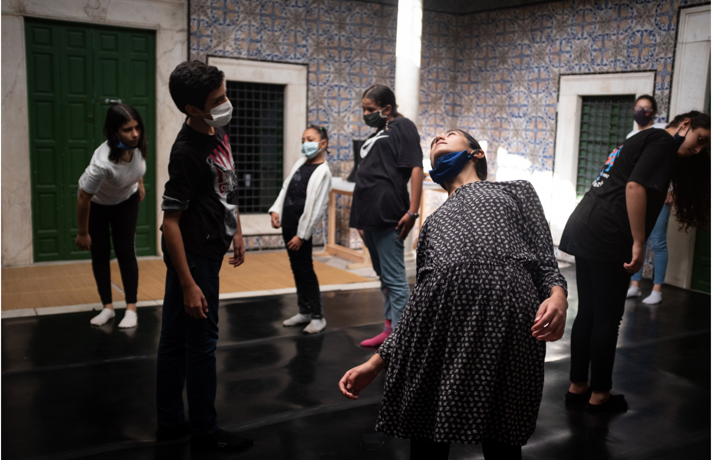
Atelier de théâtre à L'Art Rue, médina de Tunis, 2020