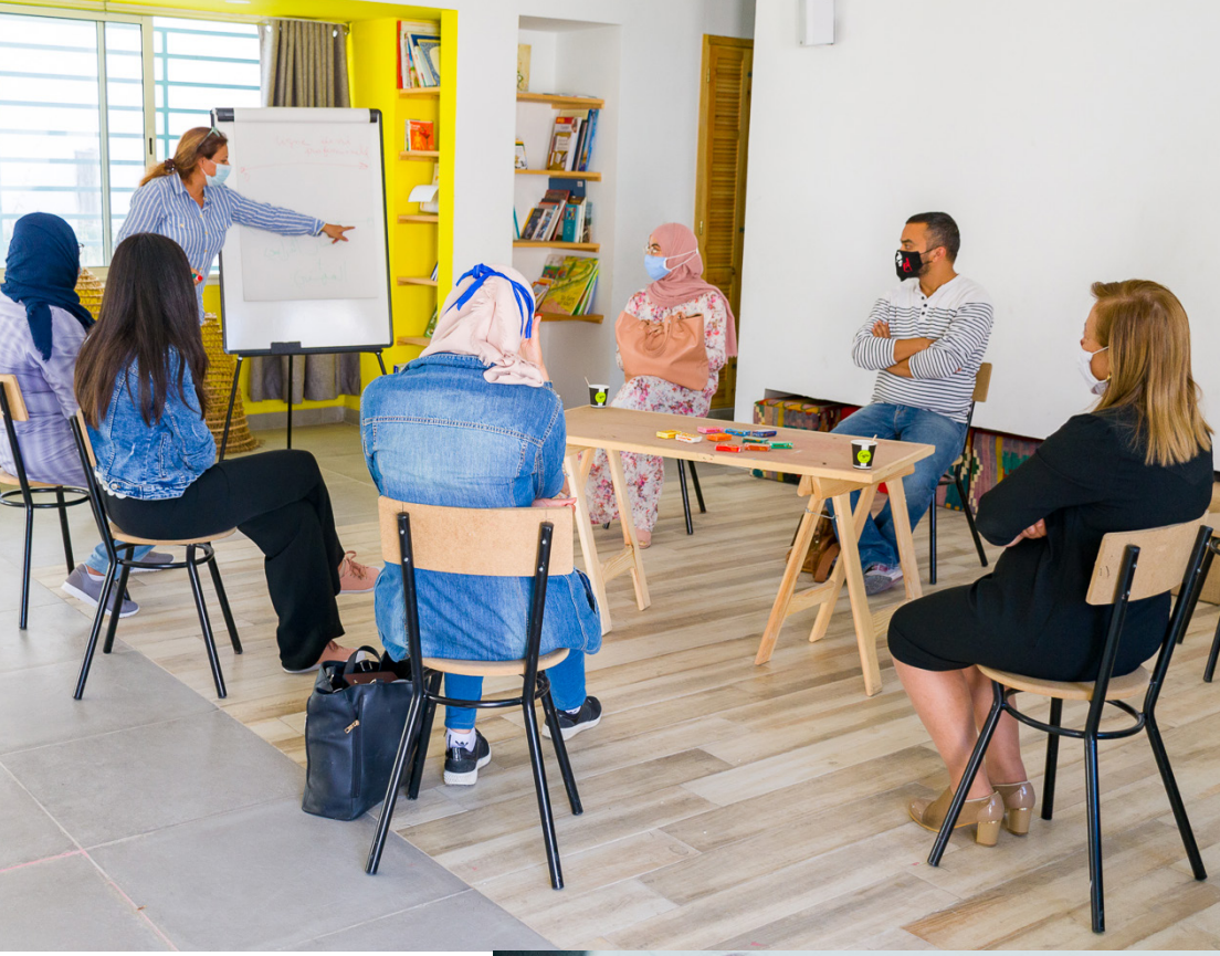
Analyse des pratiques professionnelles avec les enseignants de l'école Rue el Marr, médina de Tunis, 2020 ©Pol Guillaud.