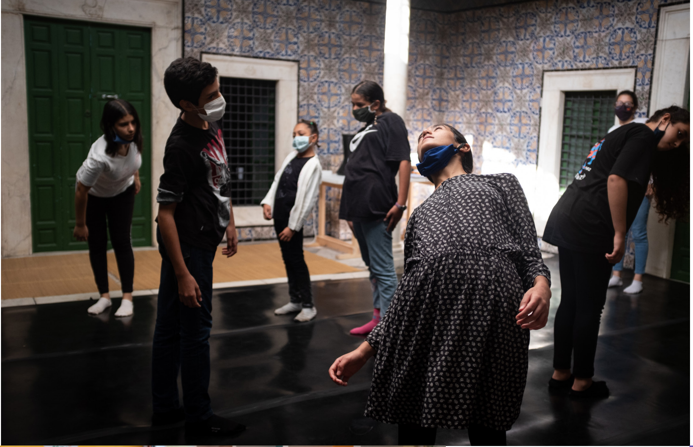
ورشة المسرح في جمعية الشارع فن، تونس المدينة.