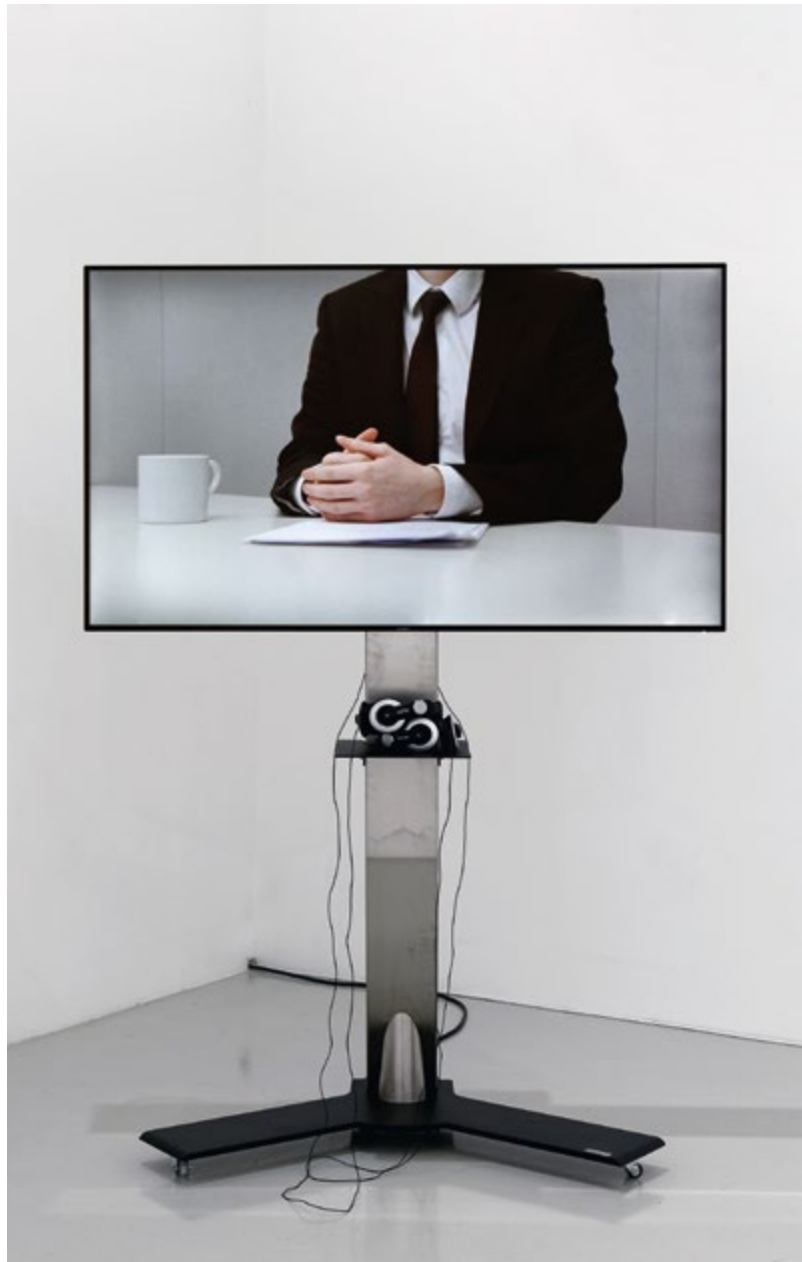
Cally Spooner, Off Camera Dialogue , 2014. Vidéo, 6 min. Collection Frac Franche-Comté © Cally Spooner

Cally Spooner produit des pièces de théâtre et des courts textes dénués d'intrigue, des monologues qui tournent en boucle, des comédies musicales et des arrangements sonores qui lui permettent de mettre en scène les mouvements et les comportements du langage. D'origine anglaise, l'artiste développe ses projets sur de longues périodes. Elle incorpore souvent la durée et la répétition comme actes de résistance à l'émergence de la performance et de la compétitivité, toujours recherchées, en tant que régime de pouvoir et condition de réussite absolue.