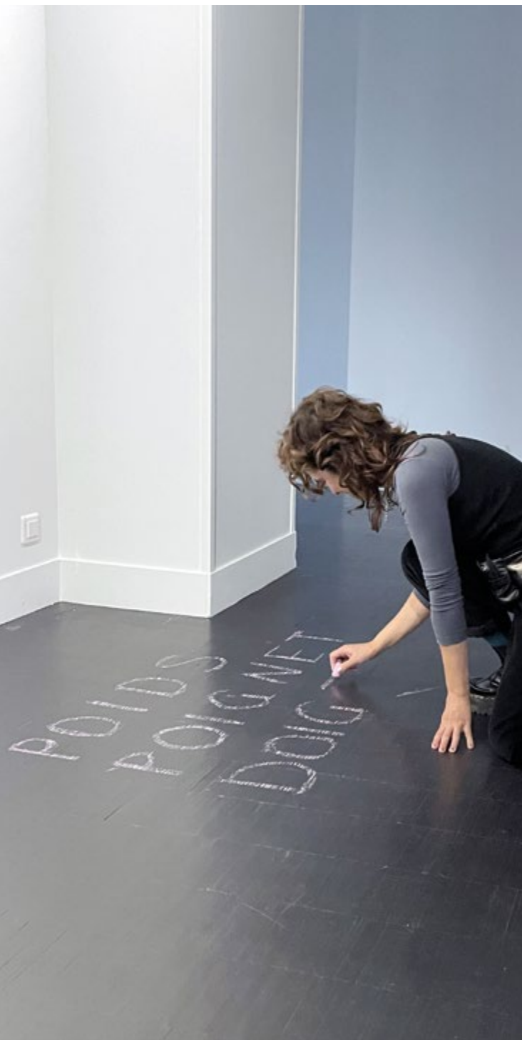
Madeleine Aktypi, Coulée continue / CŒUR LIQUIDE (étape de travail), 2024. Installation in situ , craie rose sur bois noir.