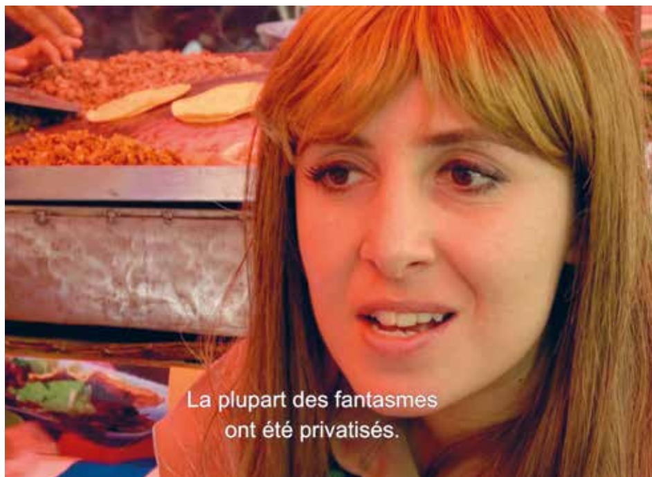
Liv Schulman, A Somatic Play , 2019