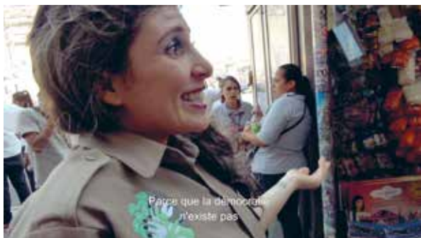
Liv Schulman, A Somatic Play , 2019 Video 4k couleur 32 min. © Liv Schulman

■ SECOND VOLET du samedi 21 février au samedi 30 mai Vernissage Samedi 21 février à 16h