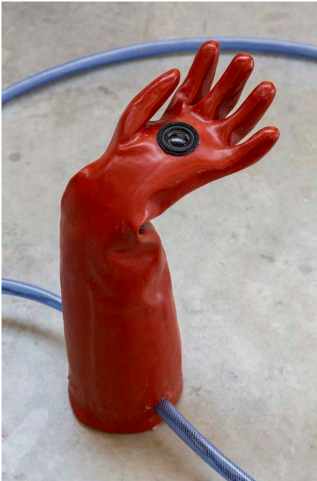
Carla Adra, Gantophonie , 2024, 8 gants de Bassan en latex, résine époxy, composants électroniques, haut-parleurs, tubes pvc, pièce sonore en boucle de 8 pistes.