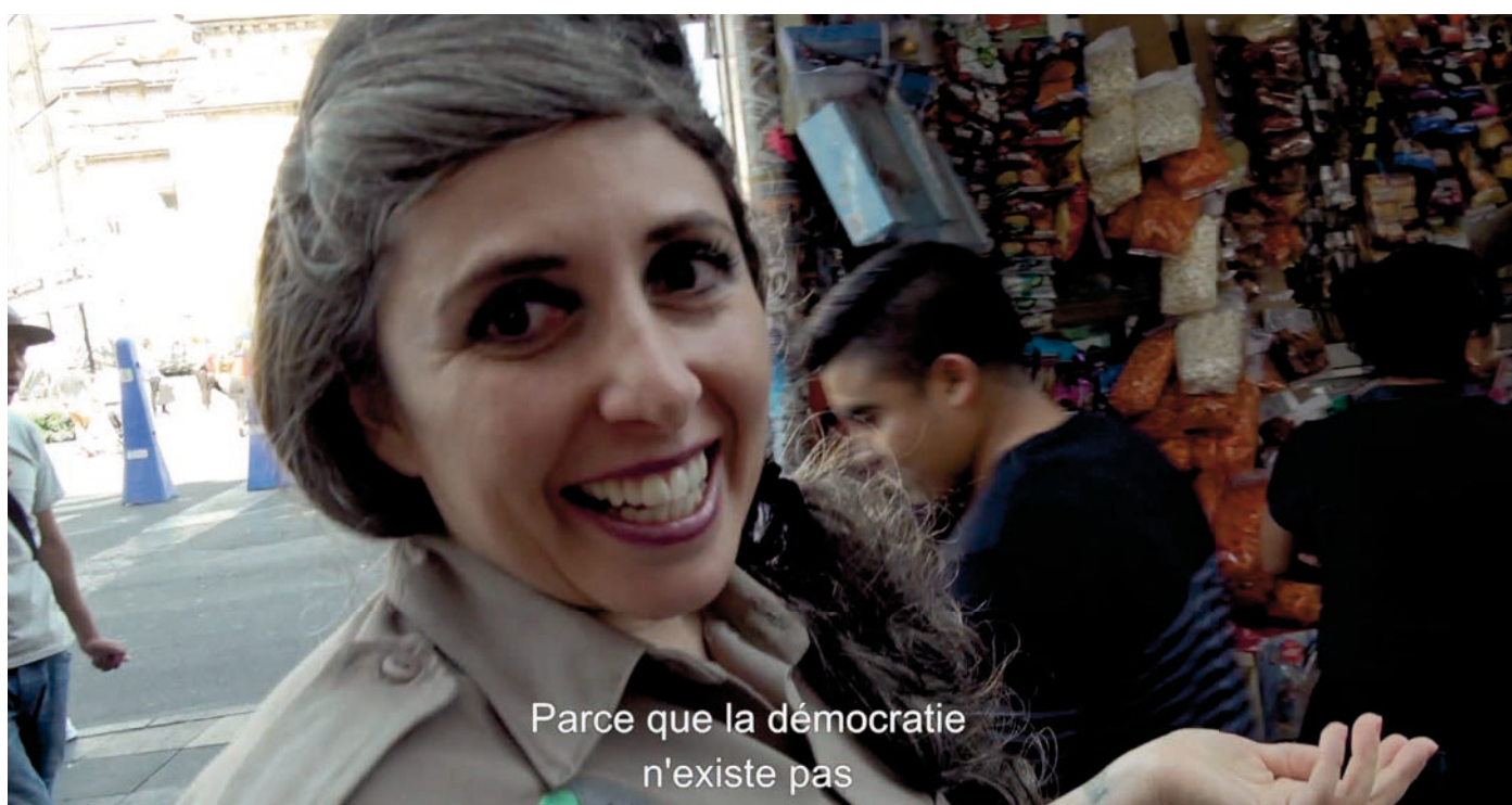
Liv Schulman, A Somatic Play , 2025 Vidéo 4k couleur 32 min. © Adagp, Paris, 2025