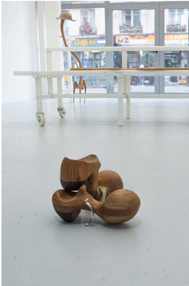
Elliott Paquet KM&M'S (Shoes) Noyer, cuir, aluminium, quincaillerie, 2022.