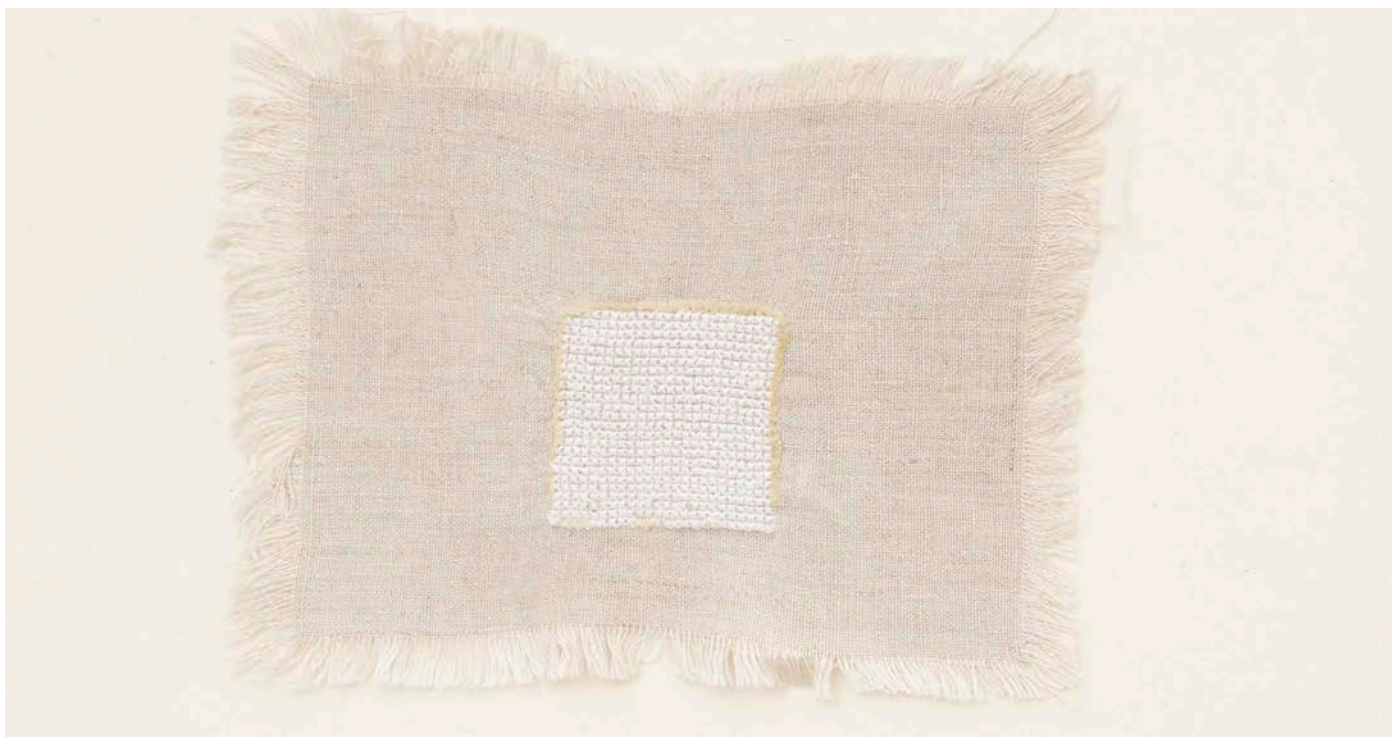
Majd Abdel Hamid, Son, this is a waste of time , 2020, Broderie de fils de coton sur coton © Majd Abdel Hamid Collection Frac Franche-Comté