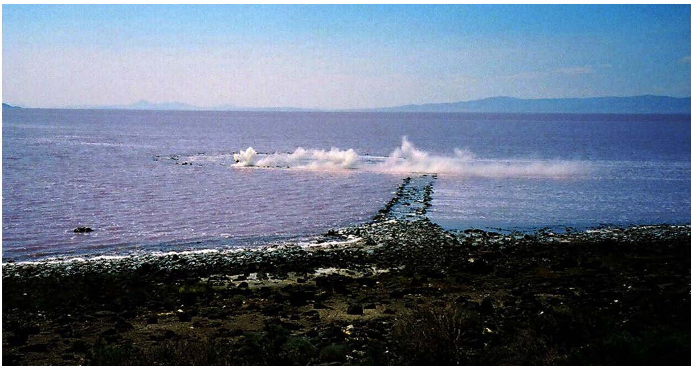
Cyprien Gaillard, Real Remnants of Fictive War VI , 2007 Photographie Impression lambda © Cyprien Gaillard Collection Frac Franche-Comté