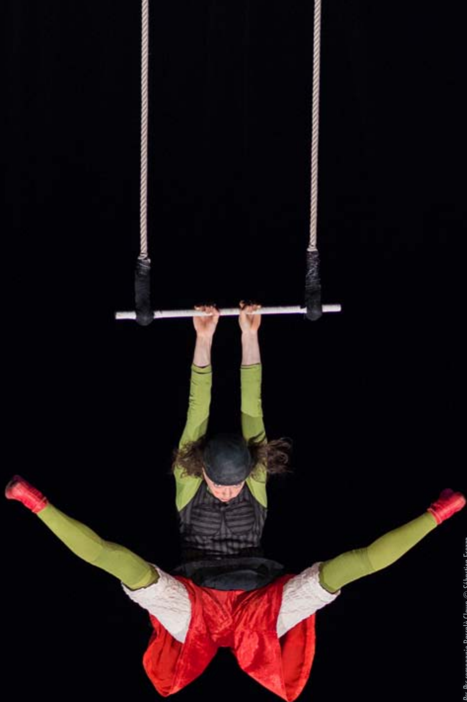
spectacle Pss compagnie Barcalà Clown