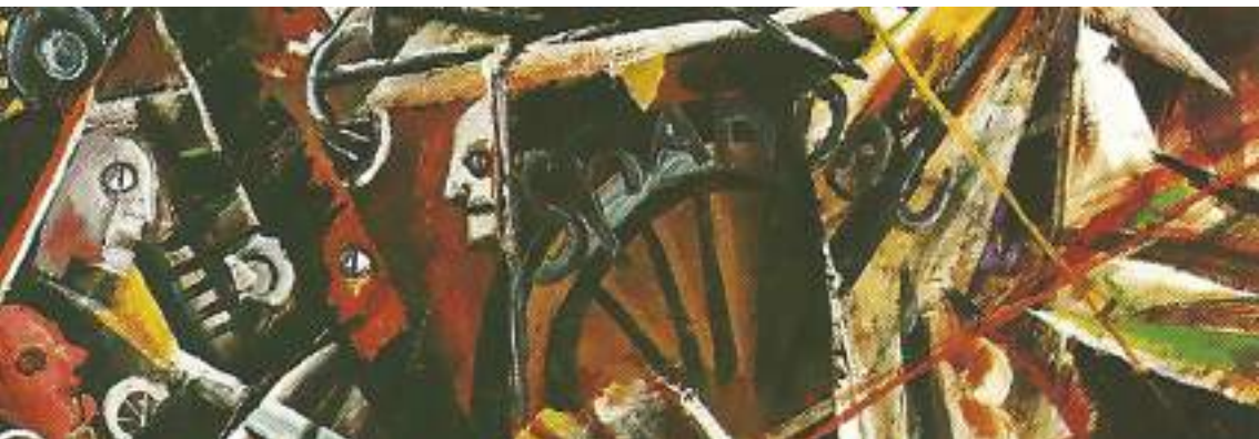
Otto Dix, Le canon , détail, huile sur carton, 1914