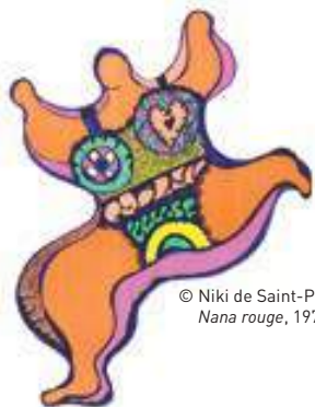
© Niki de Saint-Phalle, Nana rouge, 1970

Valerio Adami – Pierre Alechinsky Enki Bilal – Jean-Pierre Jouffroy Peter Klasen – Lionel Koechlin Jean Messagier – Jacques Monory Ernest Pignon-Ernest – Bram Van Velde Vladimir Velickovic