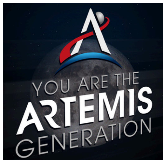
Logo de la Mission Artémis par la NASA