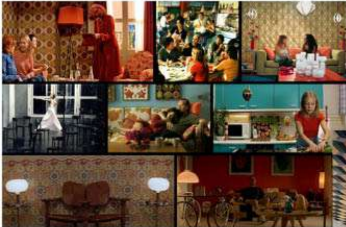
Intérieurs des films d'Almodovar