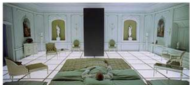
2001, l'Odyssée de l'espace. Stanley Kubrick