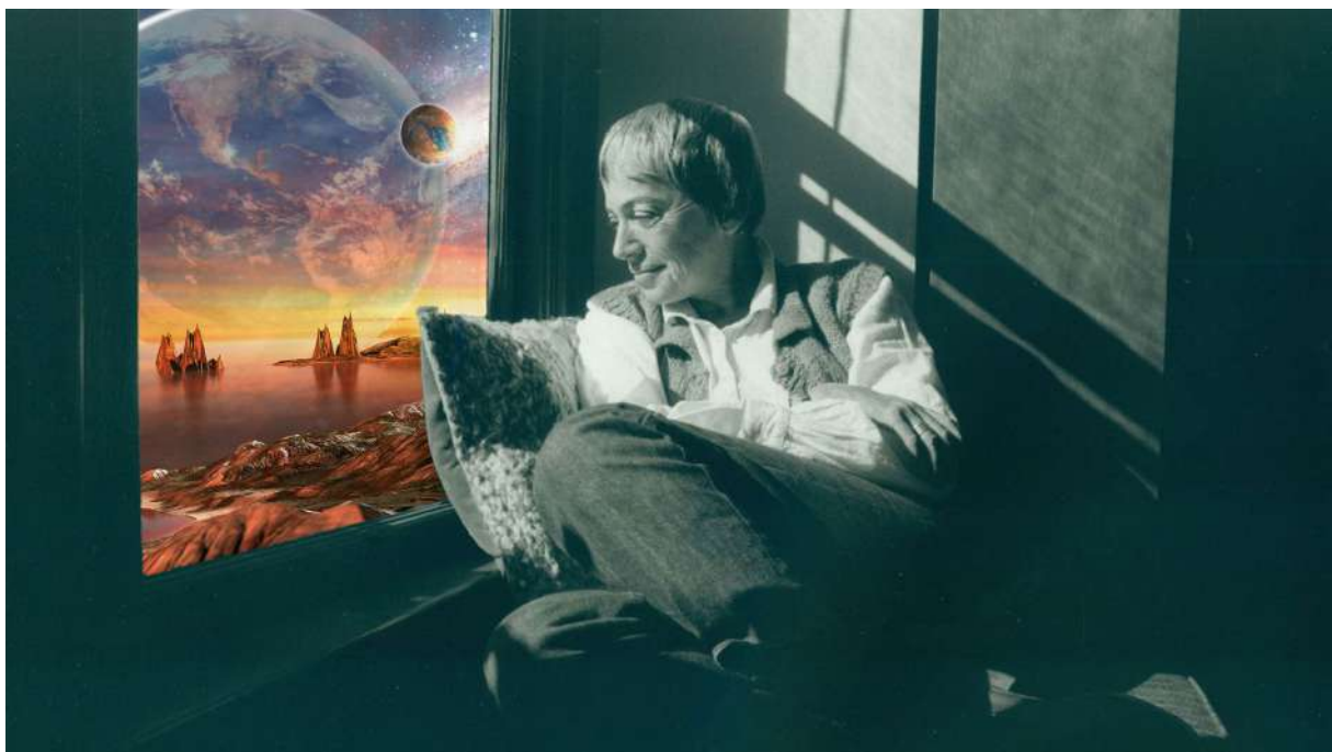
Ursula Le Guin

Peut-être qu'ici nous pourrions travailler à quelque chose d'impossible de manière réelle. Ou à un réalisme qui frôle l'impossible. Une puissance des impossibles qui demande un effort imaginatif audacieux et qui servirait à ouvrir les horizons pour se projeter différemment dans notre réalité.