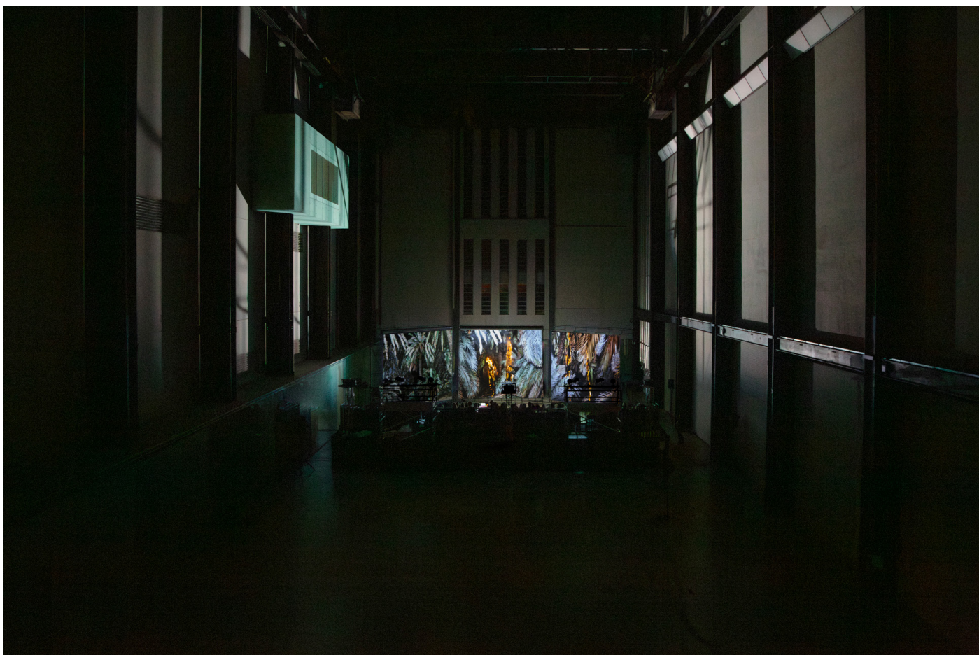
ANIMA , Tate Modern (Londres)