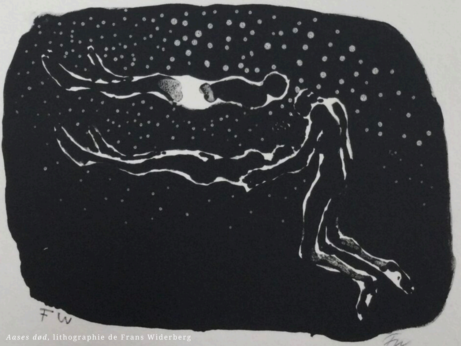
Aases død , lithographie de Frans Widerberg